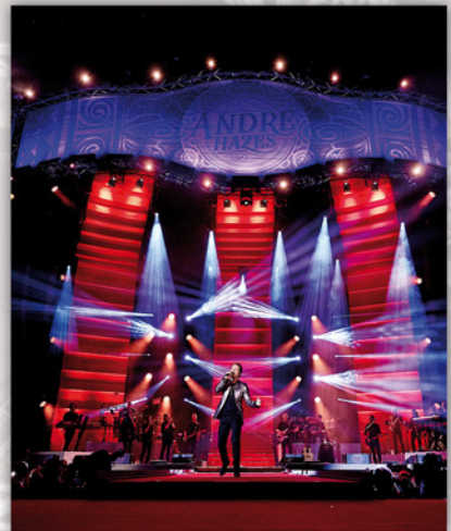
ANDRÉ HAZES LIVE ROTTERDAM AHOY