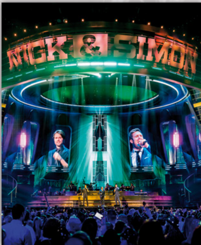
10 JAAR NICK & SIMON ROTTERDAM AHOY

Faber Audiovisuals www.faber-av.com 088 322 37 00