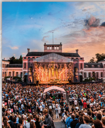
ROYAL PARK LIVE PALEIS SOESTDIJK