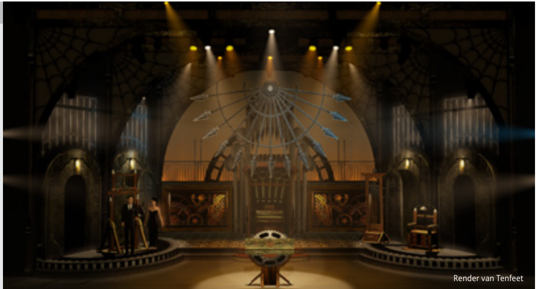
Render van Tenfeet

Tijdens de programmeersessies werden elke dag nieuwe video-opnames van de repetities toegestuurd en konden de posities van de acteurs goed bepaald worden en in de virtuele set vooraf worden belicht, waardoor een vrij complete showfile ontstond. Berendsen: "De studio blijkt altijd een life-saver te zijn, aangezien je nooit klaar bent met iets mooier te maken. Door vooraf al de set virtueel te hebben bekeken, kun je de tijd op locatie vele malen effectiever gebruiken! Acteurs repeteerden daardoor veel van de scènes in het theater al vanaf dag één in de juiste lightsfeer."