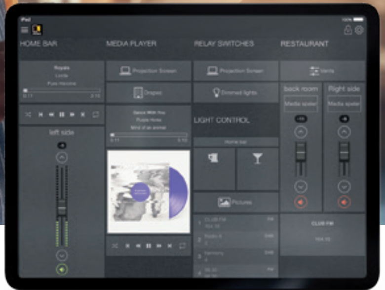
AUDAC Touch™ 2