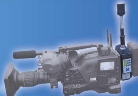
Nu te huur: PDW700 + HD Videozender

Draadloze camera systemen & Point to Point verbindingen