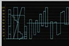
Faithful conversion from super-blacks to super whites

Support for 1080p 3G-SDI. 3G bps 1080/60p