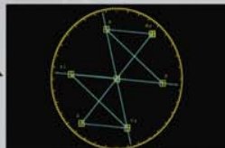
Faithful conversion of color phase and chroma