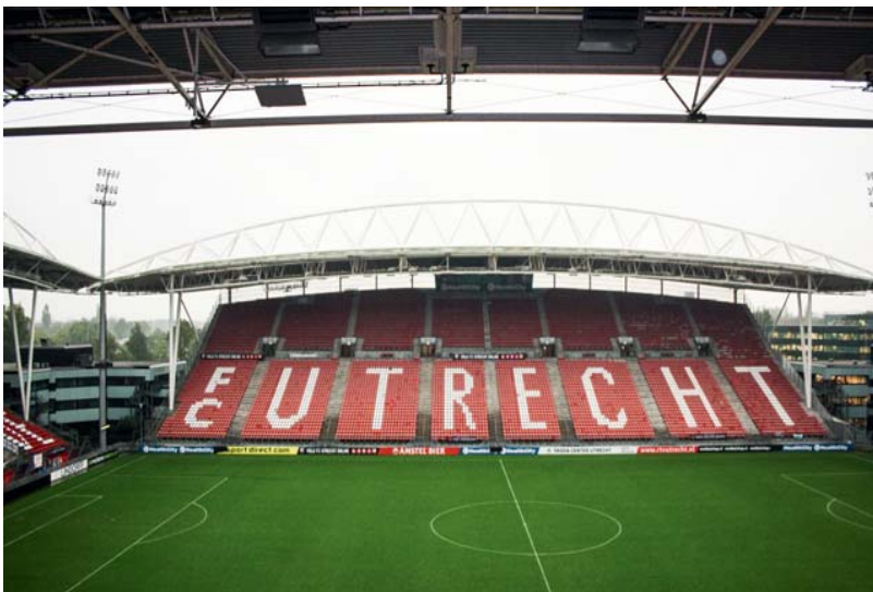
De skyboxen boden een fantastisch uitzicht op het veld.

De eerste autotestdag van Utrecht Business vond op 5 november plaats. De animo om zakenauto's aan een kritische blik te kunnen onderwerpen was overweldigend. Na een goed verzorgde lunch bij startlocatie Postillion Hotel Utrecht Bunnik werden tijdens de stops bij het Koetshuis van Kasteel de Haar en Stadion Galgenwaard de bevindingen vastgelegd in de testverslagen. De dag werd uiterst geslaagd afgesloten met een dinerbuffet bij Postillion Hotel Utrecht Bunnik.