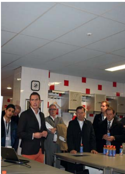
In de kleedkamers werd uitleg gegeven over onder andere FC Utrecht Business.