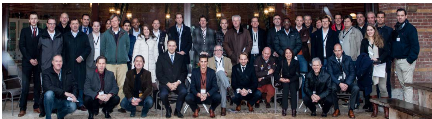
Een grote groep testrijders stond klaar om de zakenauto's uit te proberen.