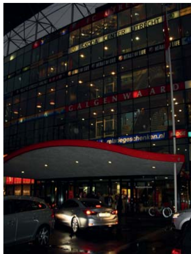
Na een lange dag stapten de deelnemers weer in de auto richting Postillion Hotel Utrecht Bunnik voor het diner.