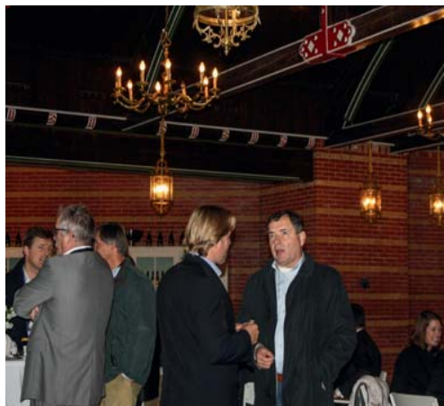
Er werden veel nieuwe contacten gelegd.