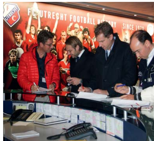
De deelnemers vulden ijverig de testformulieren in.