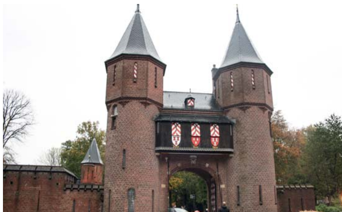
De eerste pitstop was bij het grootste kasteel van Nederland, Kasteel de Haar in Haarzuilens.