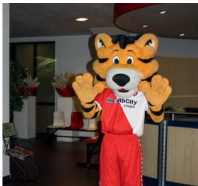
'Tiger', de mascotte van FC Utrecht, verwelkomde de testrijders bij Stadion Galgenwaard.