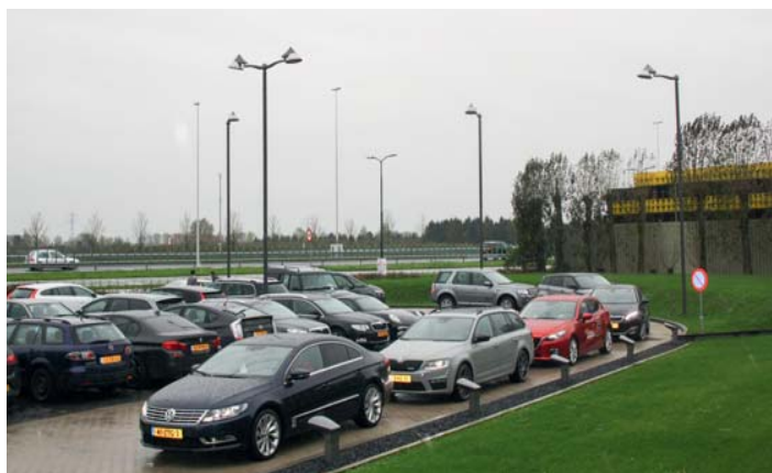
Op de parkeerplaats van Postillion Hotel Utrecht Bunnik vormden de zakenauto's een lange stoet.