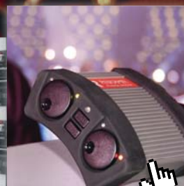
PERFORMER Digital Partyline Intercom