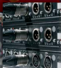
ROCKNET Digital Audio Network