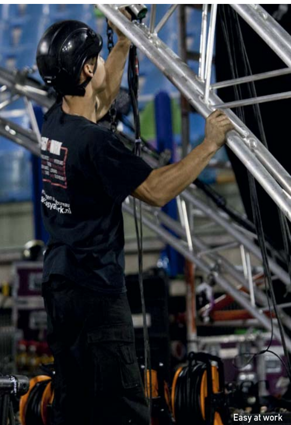
Easy at work

The Light Connection – ook aanwezig op de beurs - is de Nederlandse importeur van JANDS lichtregelsystemen, Next dim-