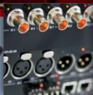
MEDIORNET Real-Time Media Network