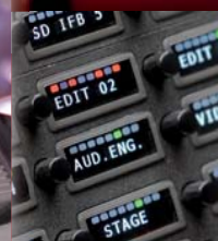
ARTIST Digital Matrix Intercom