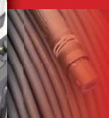
PURE Heavy Duty Fiber Cable