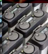
ACROBAT Digital Wireless Intercom