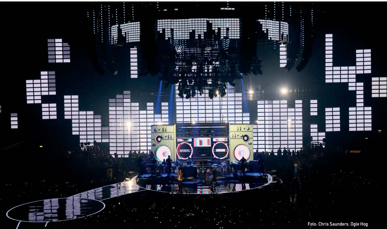
Ogle Hog