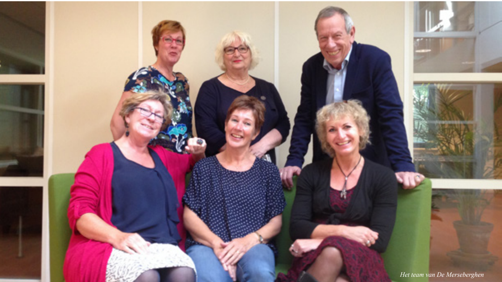
Het team van De Merseberghen

De meerwaarde van Kantorenhuis De Merseberghen