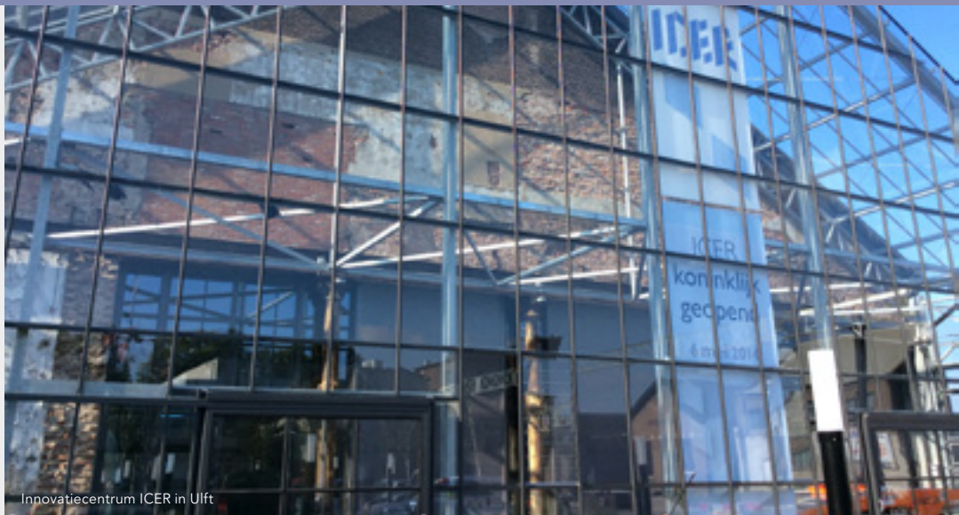
Innovatiecentrum ICER in Ulfst

De Achterhoek is een echte broedplaats voor innovatie. Die vindt plaats in de tien Innovatiehubs die de regio telt, en natuurlijk bij veel bedrijven zelf. Verschillende innovatieve en innovatie-aanjagende partijen vertellen wat er zoal in de regio gebeurt.