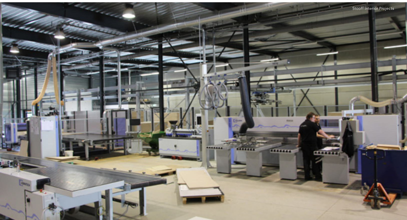
Stooff Interior Projects

digital signing via schermen en displays. Omdat we alle denkbare vormen van signing kunnen ontwerpen, produceren en implementeren, profileren we ons dan ook niet als productiebedrijf, maar als servicegericht bedrijf. We kunnen zelfs voor winkels met meerdere filialen een webshop op maat bouwen zodat er per filiaal materiaal kan worden besteld. Dit is niet alleen handig voor retailwinkels, maar ook voor dienstverlenende bedrijven die steeds vaker onder één paraplu opereren.” Retailwinkels zijn een belangrijke klant voor Virupa, maar deze zijn wel conjunctuurgevoelig. Immink houdt om die reden de voorraden beperkt. “Door op demand te produceren, beperken we het risico. We leveren de klant maatwerk, want elke winkel heeft andere afmetingen en een eigen indeling. Bovendien spelen we zo ook goed in op de signingvraag van de vele tijdelijke winkels die je in het straatbeeld terug ziet. Daarnaast kijken we voortdurend hoe we onze producten en service kunnen verbeteren door bijvoorbeeld met vraagstukken van de klant aan de slag te gaan. Daar is onder andere een gebruiks-