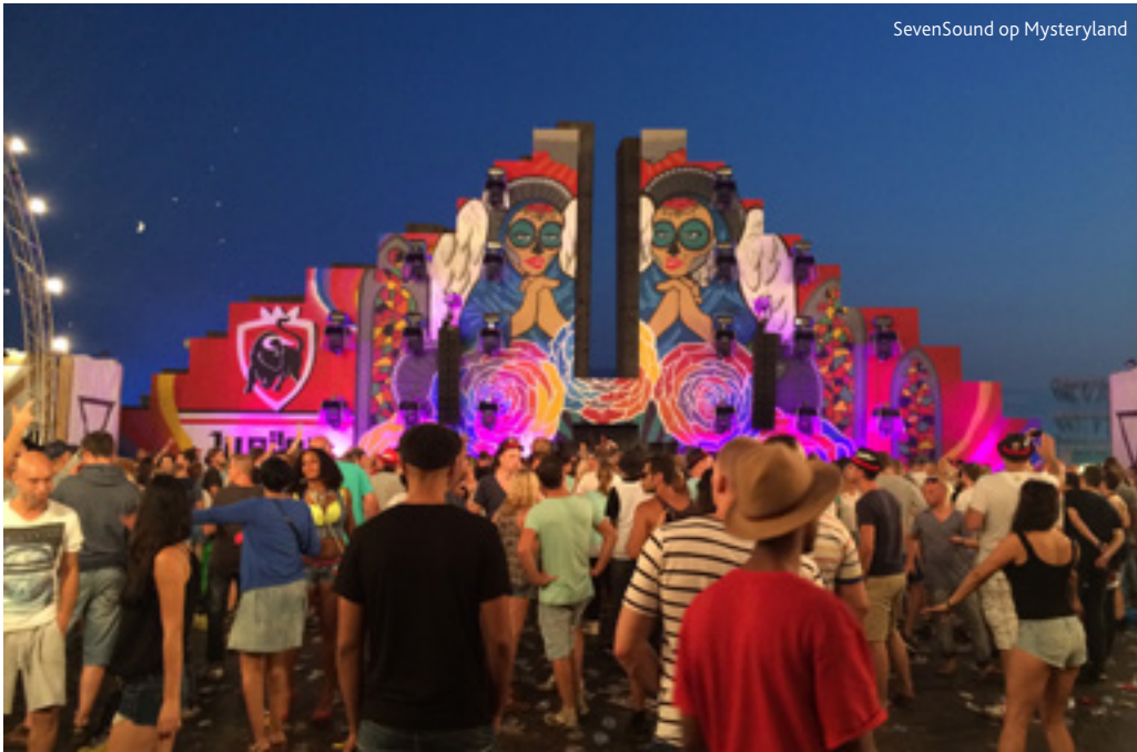
SevenSound op Mysteryland

laatste technieken en lopen we zeker niet achter op de concurrentie.”