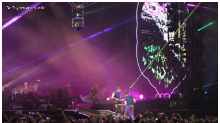
De Spydercam in actie

De 'A Head Full Of Dreams World Tour' heeft de primeur van de VER Revolution Display M8 processor. De in-house ontwikkelde LED processor, die er voor zorgt dat de content zo snel mogelijk op de juiste plek, in de juiste kleur en hoogste kwaliteit op het scherm komt, is vaak een bron van frustratie bij het hedendaagse complexe gebruik van schermen. De M8 is een native 4K LED processor die alle frustraties wegneemt en een geweldige intuïtieve controle biedt voor een breed scala van LED producten. Dit vond althans de jury van de 2016 Live Design Projection Product Of The Year Award, de prijs die de VER Revolution Display M8 onlangs in wacht sleepte: "Een krachtig gereedschap waarmee uren aan productietijd kan worden bespaard en die elke pixel laat schitteren."