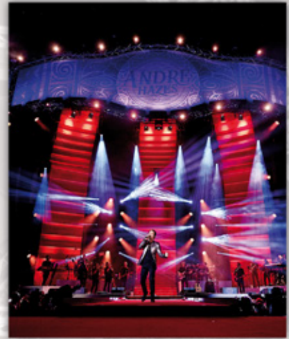
ANDRÉ HAZES LIVE ROTTERDAM AHOY