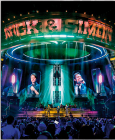
10 JAAR NICK & SIMON ROTTERDAM AHOY