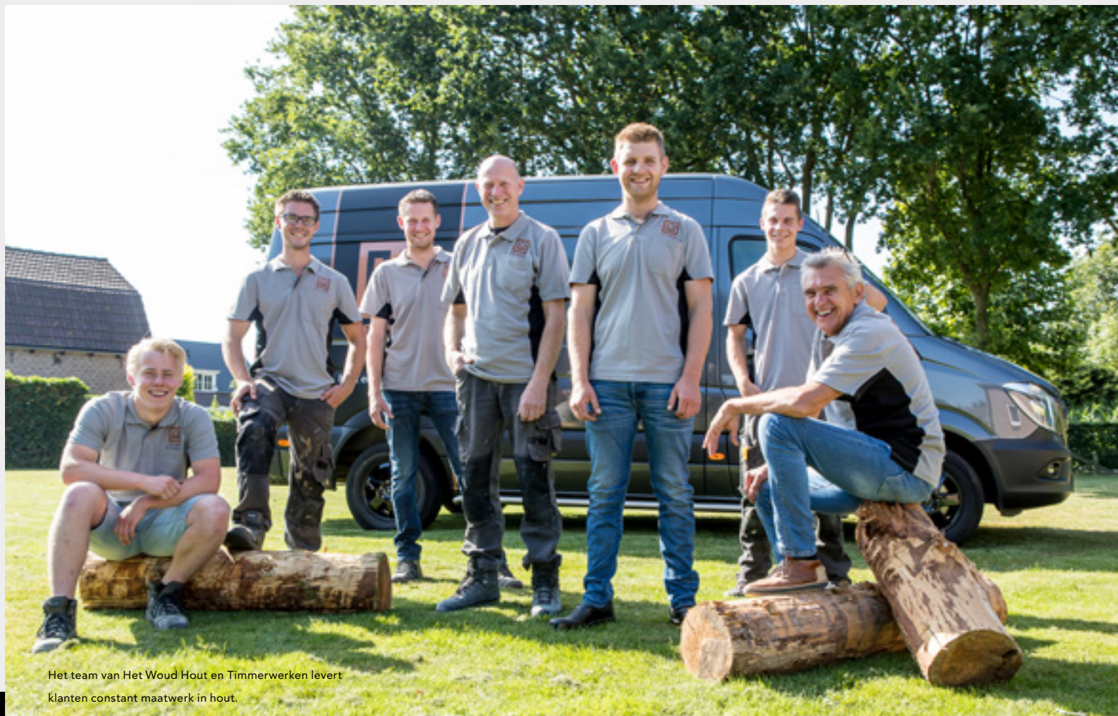
Het team van Het Woud Hout en Timmerwerken levert klanten constant maatwerk in hout.