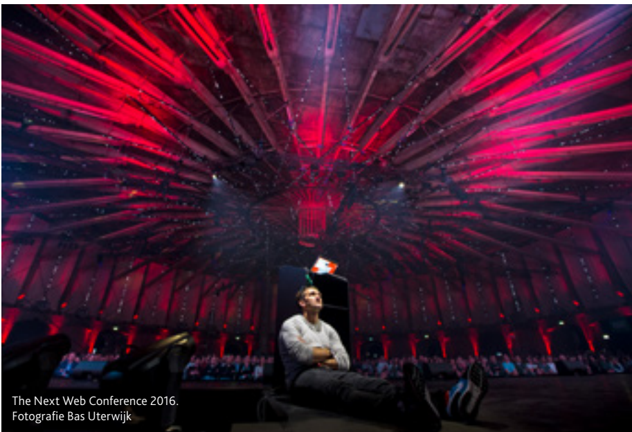
The Next Web Conference 2016.

Naast meer dan 500 sessies, workshops en activiteiten voor zowel de professional als de Amsterdammer werden er ook diverse randactiviteiten met dit thema georganiseerd zoals voorstellingen, exposities en speciale fietsroutes. Voor de organisator van het International Aids Society hebben we het volledige voortraject van bid, site-inspectie en diverse werkgroepen georganiseerd. Voor de congresdeelnemers verzorgden we onder andere een gepersonaliseerde plattegrond, een perstrip en diverse vormen van city dressing gedurende het congres."