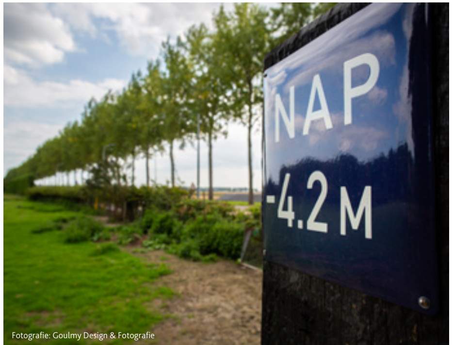
Fotografie: Goulmy Design &amp; Fotografie

In oktober gaat Convention Bureau Event Park Amsterdam officieel van start en wordt ook het online platform gelanceerd. Dirksen: "In principe richten we ons op corporate events en congressen tot 500 deelnemers. Met name de kleinere internationale congressen zijn op zoek naar een unieke locatie. Met Event Park Amsterdam bieden we Haarlemmermeer aan als een totaalpakket; met een luchthaven, hotels, eventlocaties, professionele toeleveranciers, restaurants en ruimte voor ontspanning. We kunnen hier alles faciliteren. Je hoeft niet eens