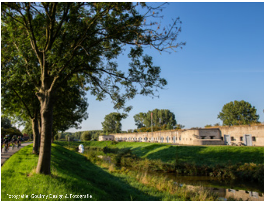
Fotografie: Goulmy Design &amp; Fotografie

Op dit moment zijn er al tweeëntwintig partners aangesloten. Naar verwachting zal dit snel doorgroeien naar dertig. Smilde: "De partners en wijzelf zijn ontzettend enthousiast. We weten dat we een mooi merk in handen hebben, dat we met behulp van alle beschikbare technologie en gevoed door de continue ontwikkelingen in de regio goed in de markt kunnen zetten. Het is nu nog een kwestie van uitrollen."