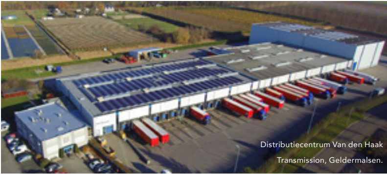
Distributiecentrum Van den Haak Transmission, Geldermalsen.