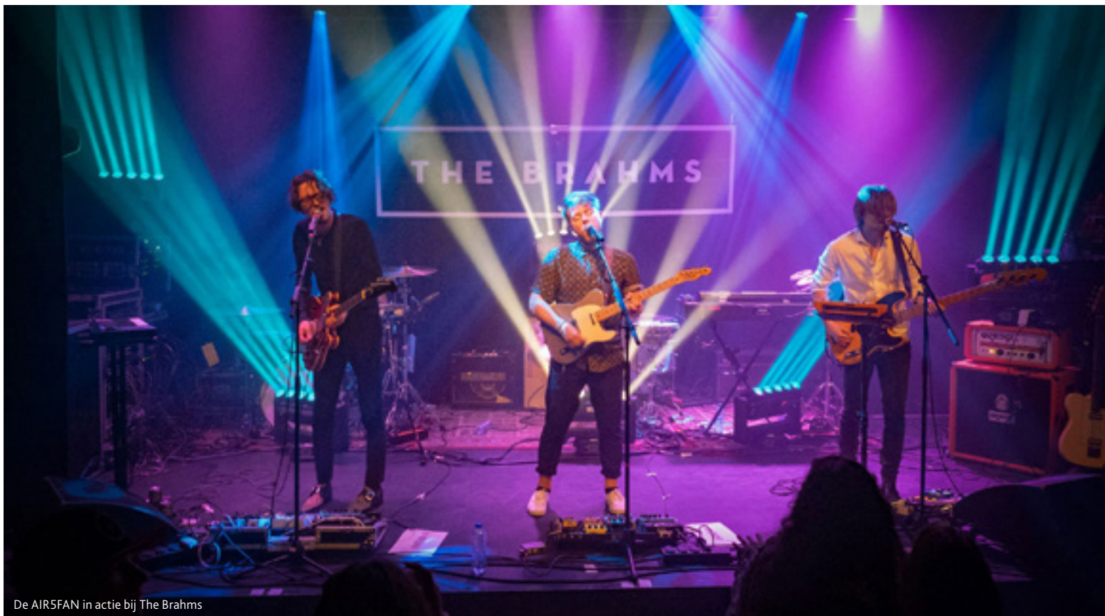
De AIR5FAN in actie bij The Brahms