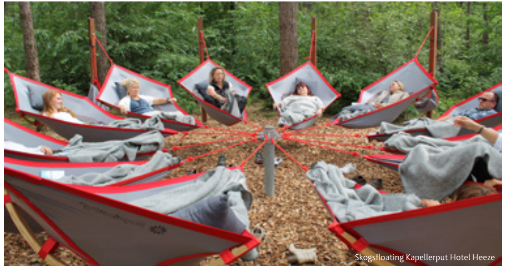
Skogsfloating Kapellerput Hotel Heeze