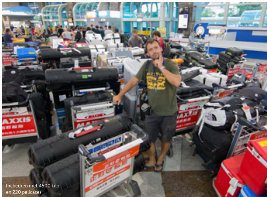
Inchecken met 4500 kilo en 220 pelicases

Drie jaar geleden had Van Zaal geen zin meer in al dat gesleur. “Ik ben naar BBP Light in Amsterdam gegaan om te vragen of er niet iets lichters te krijgen was, wat ook nog te focussen was. Ook zocht ik een vervanger voor de Chinese bol, maar dan wel op accu. Bij BBP Light zijn ze gespecialiseerd in continulicht en alles wat daarbij komt kijken en lieten ze mij de Akurat Lighting S8 zien die was net uit. “Bicolor en er zitten standaard zestig graden lenzen op”, vertelt Van Zaal. “Om meer te spotten kun je er dertig graden lenzen opschroeven. Nu kan ik bijvoorbeeld met één Akurat vanaf een afstand een standbeeld uitlichten dat in de achtergrond staat. In plaats van acht zware Velvet lights heb ik nu nog maar vier Akurat Lighting lampen nodig.” In plaats van de Chinese bol werkt Van Zaal nu met een Aladdin Lights BI-FLEX 100 Watt set. “Oké, hij geeft heel wat minder licht dan een 500 of 1000 Watt