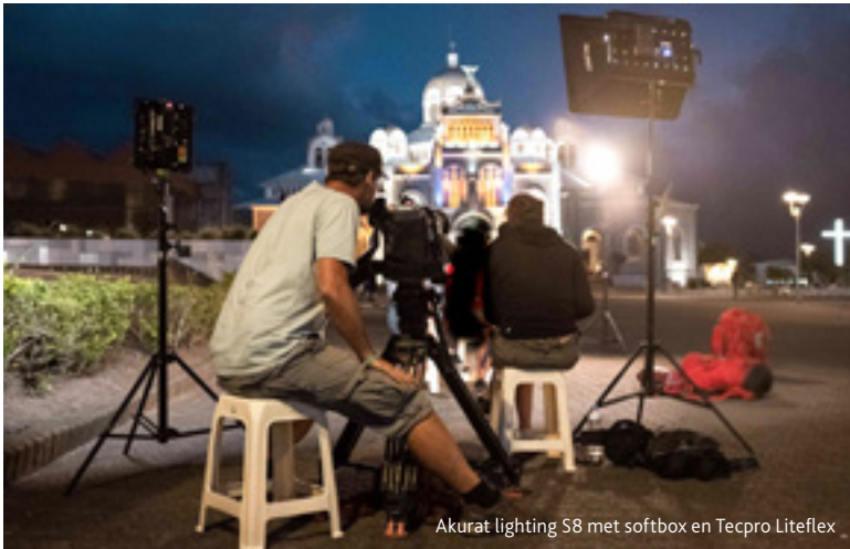
Akurat lighting S8 met softbox en Tecpro Liteflex