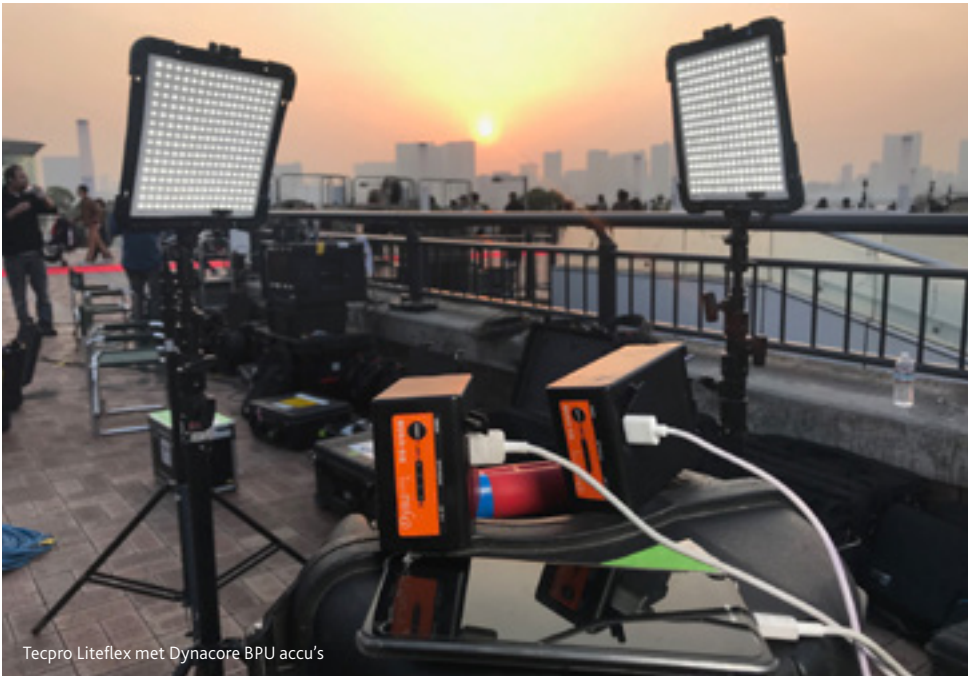
Tecpro Liteflex met Dynacore BPU accu's