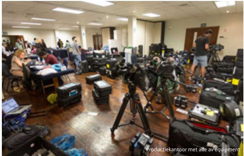
Productiekantoor met alle av equipment

gloeilamparmatuur, maar we gebruiken hem nu veel vaker omdat 'ie in een mum van tijd is opgezet en op een accu draait.' Een andere mooie oplossing die Van Zaal tegenkwam bij BBP Light was de Tecpro Liteflex van Dedolight, een waterdicht buigzaam ledpanel van 30 x 30 centimeter een met een dikte van één centimeter. "Die gebruiken we voor het interviewlicht. Bicolor, dus je kan gemakkelijk switchen van 2800 – 5600 Kelvin en bovendien is 'ie volledig dimbaar. Ze kunnen op Anton Bauer of V-lock draaien, maar ook op de veel kleinere en lichtere BPU-accu's. Wij werken nu met Dynacore BPU accu's. Op één BPU accu brandt de lamp een uur en 45 minuten op volle sterkte. Ik heb nu twee Dynacore acculaders en geef elke cameraman twee accu's mee."