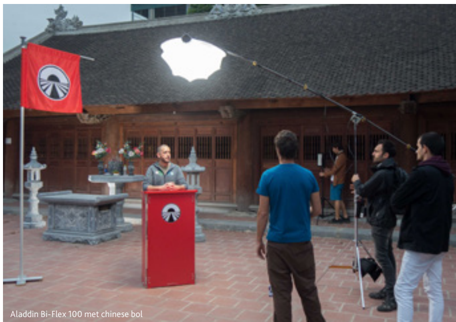
Aladdin Bi-Flex 100 met chinese bol