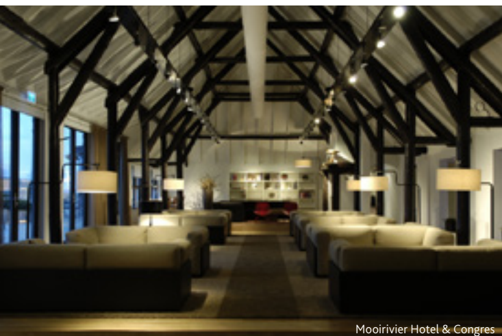
Moorivier Hotel & Congres