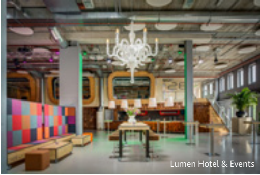
Lumen Hotel &amp; Events