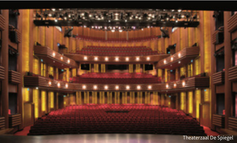
Theaterzaal De Spiegel