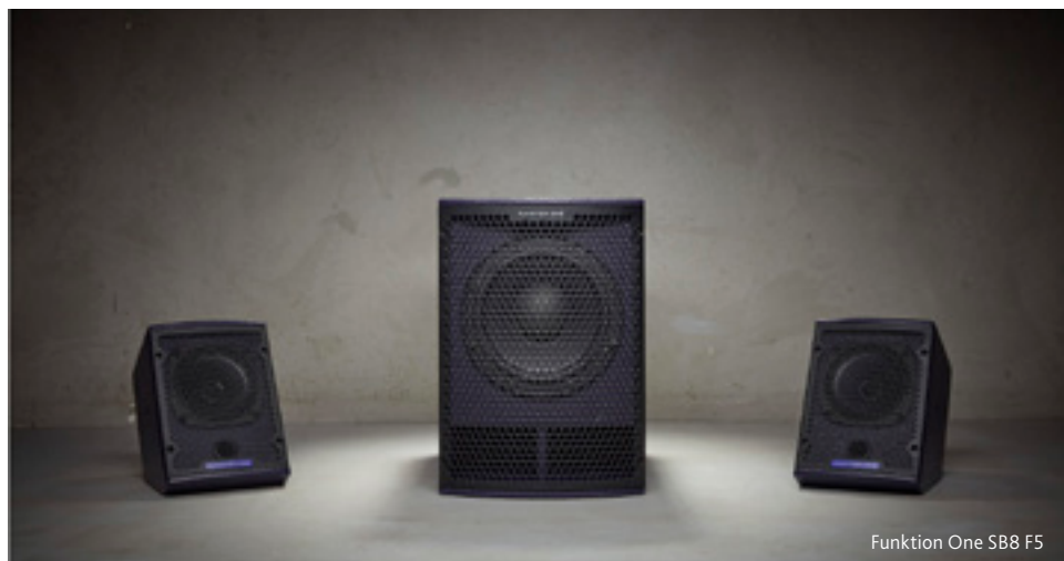
Funktion One SB8 F5

Volgend jaar vindt ISE van 2 t/m 5 februari plaats in de Gran Via - Fira de Barcelona.