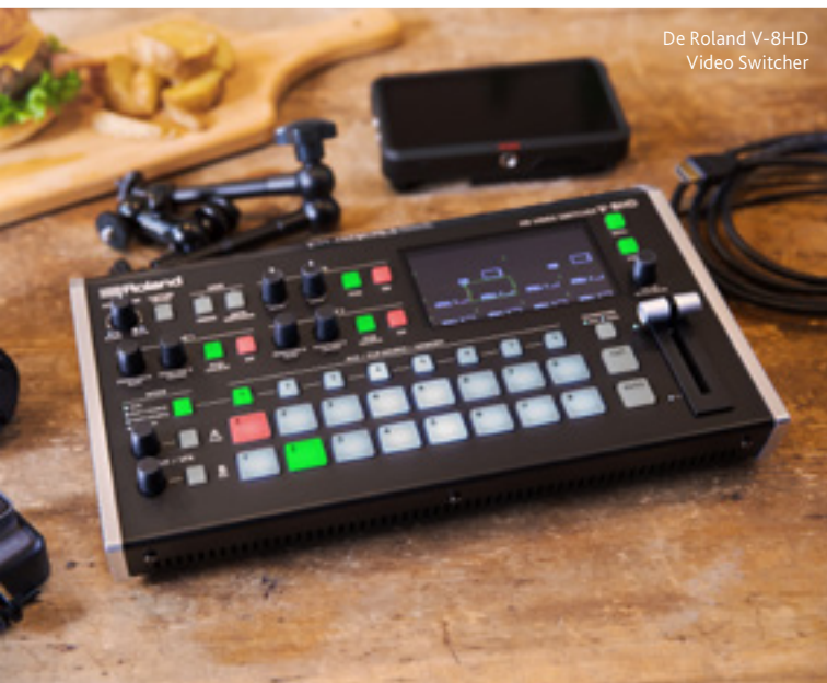
De Roland V-8HD Video Switcher