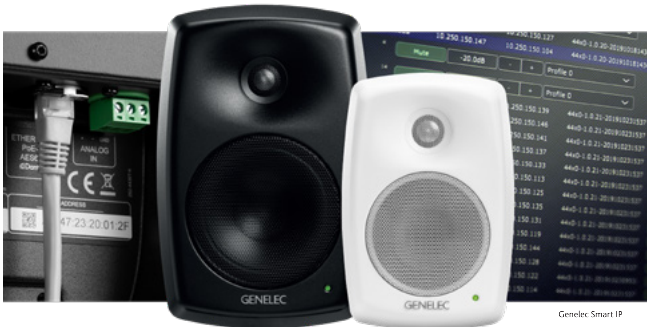
Genelec Smart IP

van de buis. De PUC 24 serie plafondbeugels zijn TÜV5 getest en gecertificeerd voor maximale veiligheid.