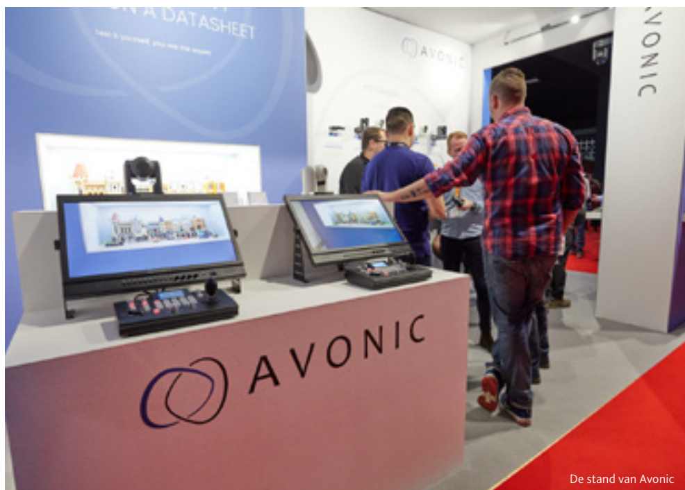
De stand van Avonic

HDMI- en USB3.0-poorten voor optimale connectiviteit en beschikt over ingebouwde microfoons voor een alles-in-één oplossing.