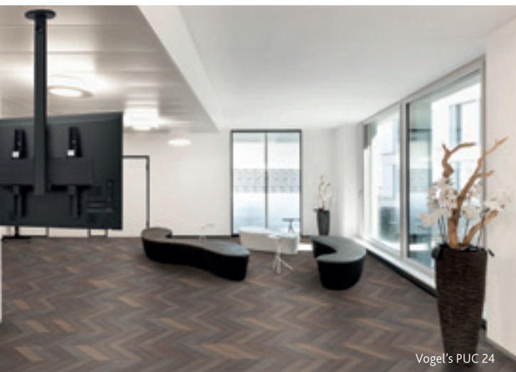
Vogel's PUC 24

zelfs in de meest krappe (werk)ruimtes. Hij kan ingezet worden voor tal van toepassingen: bij live-evenementen, in het onderwijs, in gebedshuizen, tijdens live-streaming, voor bedrijfspresentaties, e-sports en nog veel meer. Operators kunnen heel eenvoudig hun creativiteit vergroten en het publiek betrokken houden met de nieuwe 5-layer effectengengine van de V-8HD, en de ingebouwde 18-kanaals audiomixer met effecten.