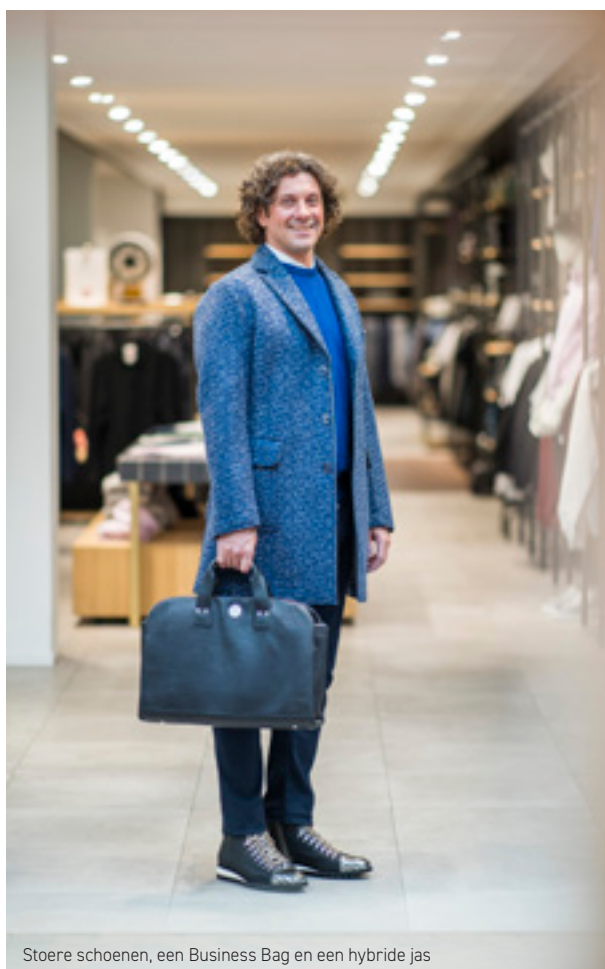
Stoere schoenen, een Business Bag en een hybride jas