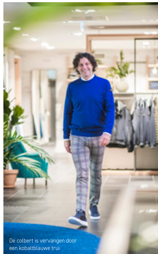
De colbert is vervangen door een kobaltblauwe trui