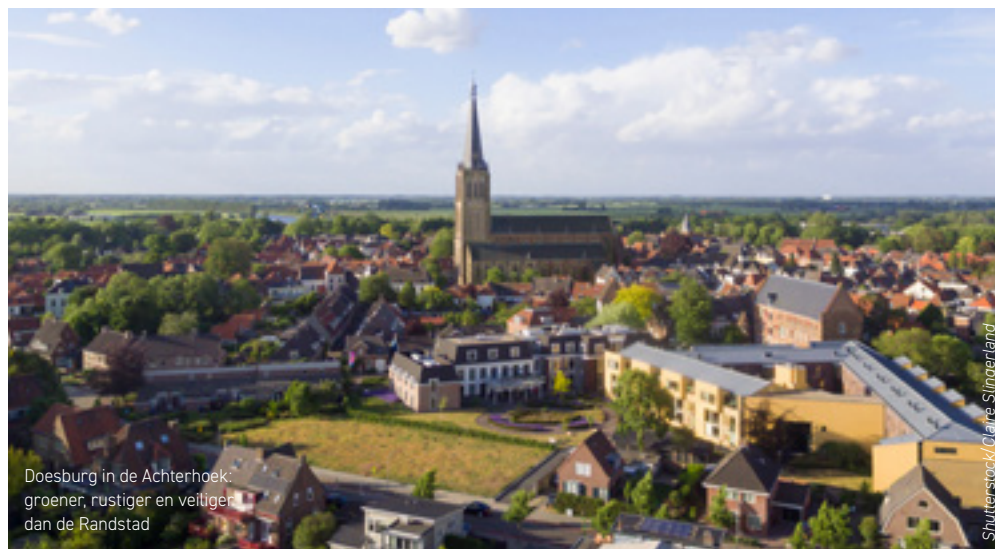
Doesburg in de Achterhoek: groener, rustiger en veiliger dan de Randstad

Maar als de ervaring toeneemt en bedrijven werken op afstand niet primair zien als kostenbesparing, zijn de voordelen enorm. De productiviteit stijgt, net als de efficiency. Vergaderingen zijn korter, meer to the point. Zakelijke reizen worden beperkt en er is minder woon-werkverkeer. Dit levert kostbare tijd op die de werk-privébalans ten goede komt. Relevante bijvangst: minder CO 2 -uitstoot en minder files. Bedrijven die dit proces goed faciliteren, krijgen toegang tot meer talent. En medewerkers hebben een ruimere keuze als gaat om hun werk- en woonplek. Kortom: het nieuwe normaal zal zeker wennen zijn maar biedt een lonkend perspectief.