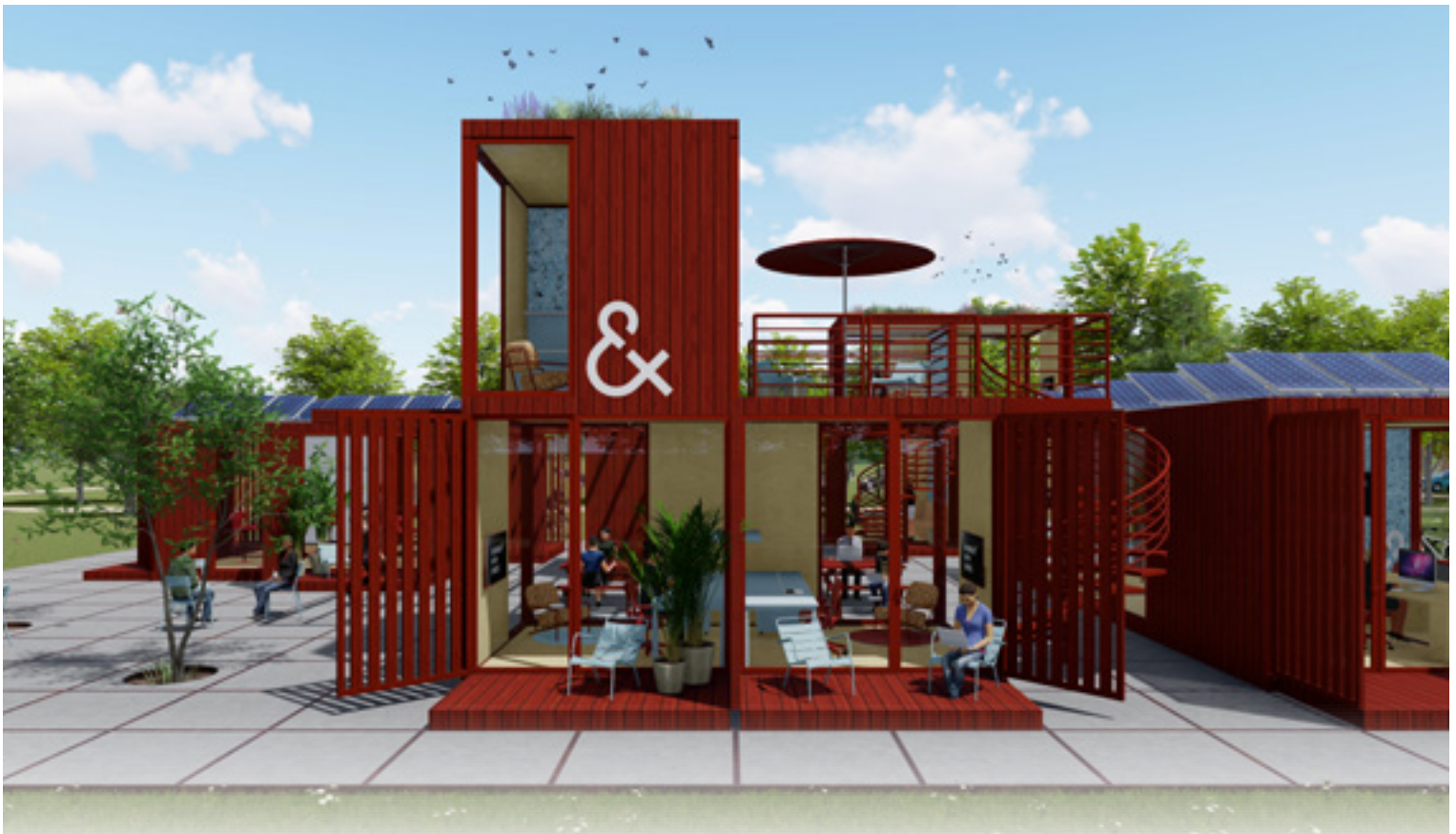
De winnende FL'EX-BOX: circulair en zelfvoorzienend (illustratie Ex Interiors).