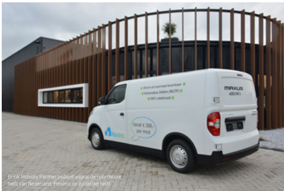
Brink Mobility Partner bedient vooral de noordelijke helft van Nederland, Fleximo de zuidelijke helft

Een kiertje hier en daar, een braampje op het dashboard en portieren die wat blikkiger dichtvallen moet je voor lief nemen, net als de op een kwetsbare plek (tegen het plafond) gemonteerde laadbakverlichting met zijn niet al te scherpe schijnsel. Op de toegankelijkheid van de opslagruimte valt, met drie wijd te openen deuren, niets af te dingen. Positief zijn verder de stevige vloerplaat en triplex wandpanelen.