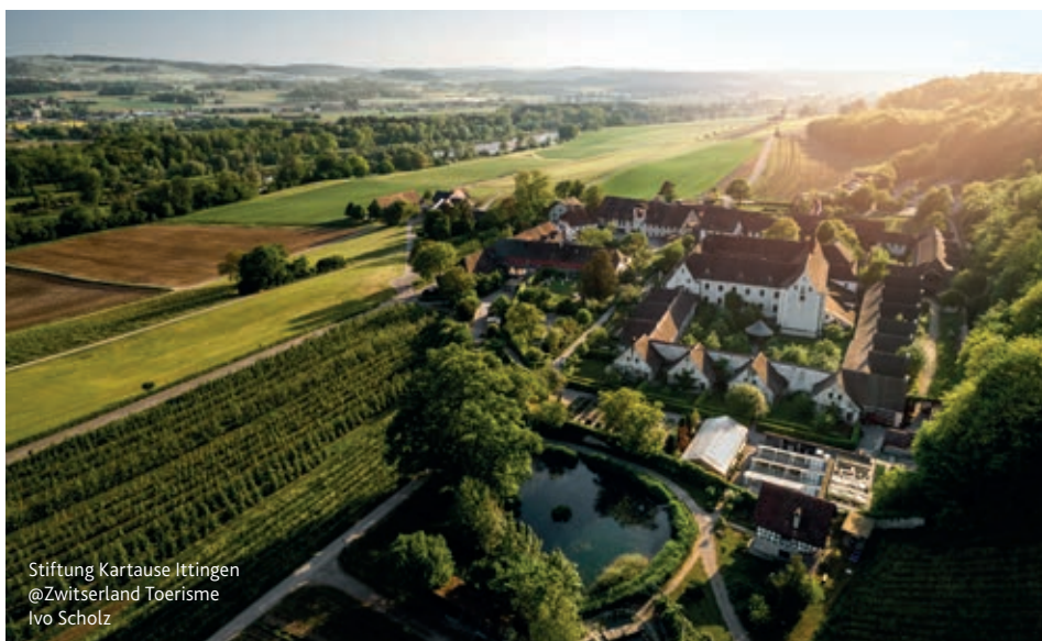
Stiftung Kartause Ittingen

Kijk voor meer informatie op MySwitzerland.com/meetings of neem contact op via scib.nl@switzerland.com / 020 620 92 29.