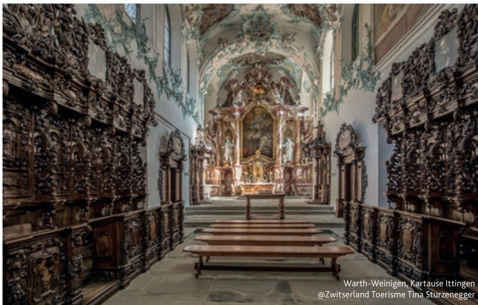
Warth-Weiningen, Kartause Ittingen

Dit hotel is gevestigd in een voormalig klooster van 800 jaar oud. Hier is ruimte voor echte creativiteit: in de authentieke ambiance van het vroegere klooster, omgeven door ongerepte natuur en verzorgde ruimten, kunnen nieuwe ideeën ontstaan. Hotel Kartause Ittingen bevindt zich in Warth-Weiningen, slechts op enkele minuten afstand van Frauenfeld en de Bodensee. Het congrescentrum heeft 25 vergaderzalen. De 68 hotelkamers garanderen een aangename nachtrust in een eenvoudig-moderne ambiance. De historische gebouwen, de binnenplaats en de uitgestrekte tuinen bieden een elegante sfeer voor alle soorten evenementen.