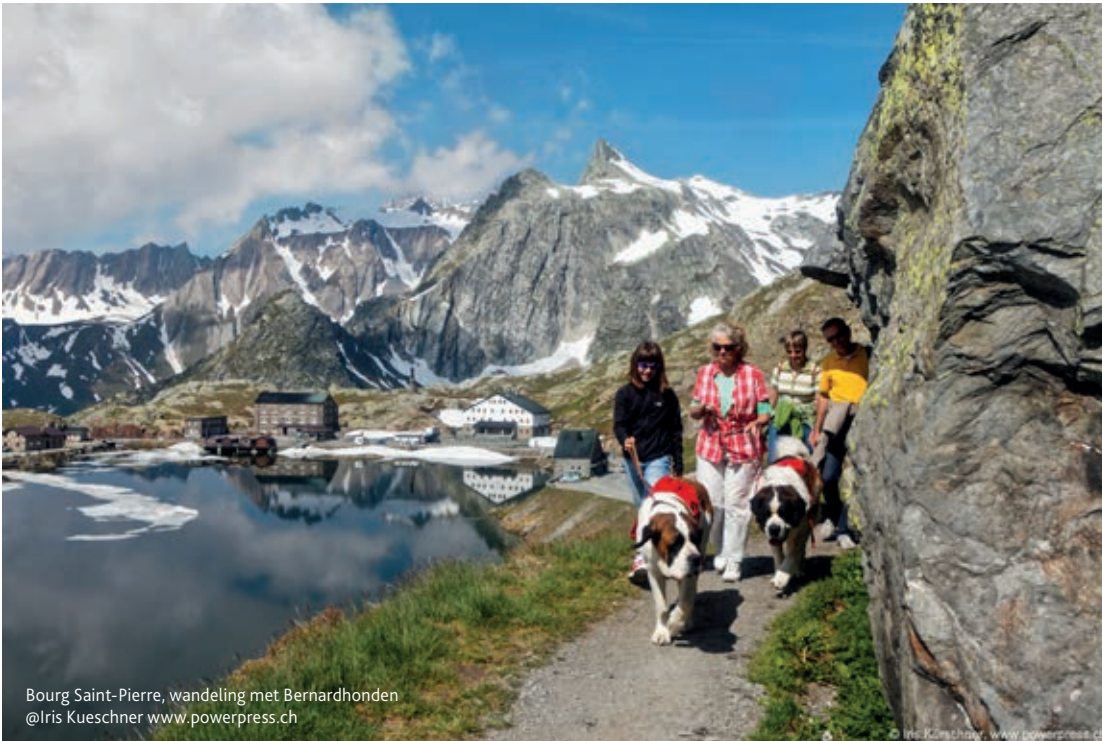
Bourg Saint-Pierre, wandeling met Bernhardhonden