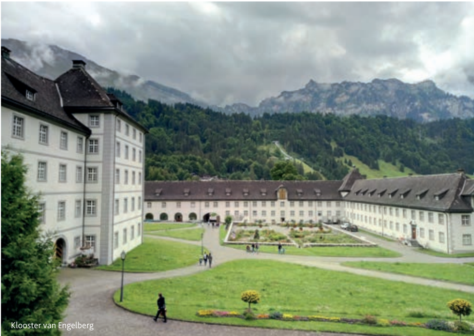
Klooster van Engelberg