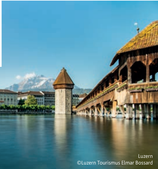
Luzern