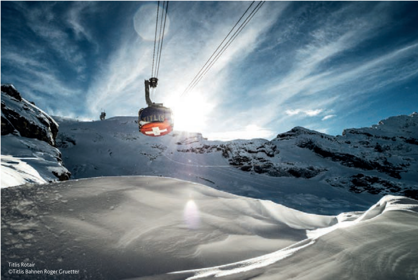
Titlis Rotair