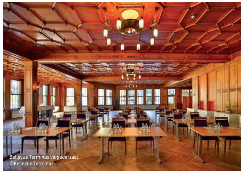
Bellevue Terminus vergaderzaal

De picknicklunch in de trein is meteen een leuke gelegenheid voor het reisgezelschap om met elkaar kennis te maken. Een heer en negen dames merken op, aan het eind van de rit, dat deze manier van reizen al heel snel een ander soort tijdsbesef geeft. In Luzern - ook wel Klein Zwitserland genoemd - wachten gids Prisca Spiller en Abel Morais van het Lucerne Convention Bureau de groep op onder de triomfboog naast het centraal station. Deze boog is enig overgebleven