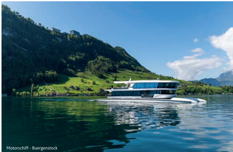
Moterschiff - Buergenstock