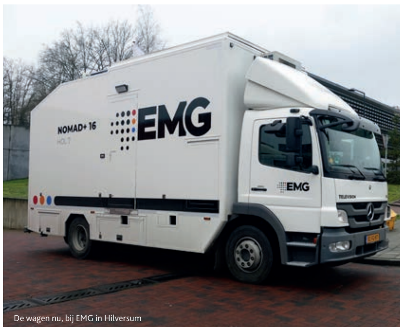
De wagen nu, bij EMG in Hilversum

De wagen wordt tegenwoordig meestal ingezet voor live-uitzendingen van bijvoorbeeld eucharistievieringen. Na de laatste update in 2018 werd de wagen opnieuw in gebruik genomen en zelfs gezegend in Sneek door de pastoor van de Sint Martinuskerk, waarbij de wagen tijdelijk rondreed onder de naam 'HOLY7'. En het einde is dus nog altijd niet in zicht voor waarschijnlijk de oudste, nog altijd in gebruik zijnde combi OBV/SNG. <