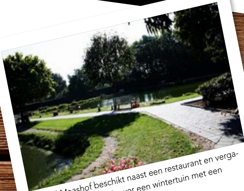
Hotel Maashof beschikt naast een restaurant en vergaderruimten ook over een wintertuin met een aantal visvijvers.