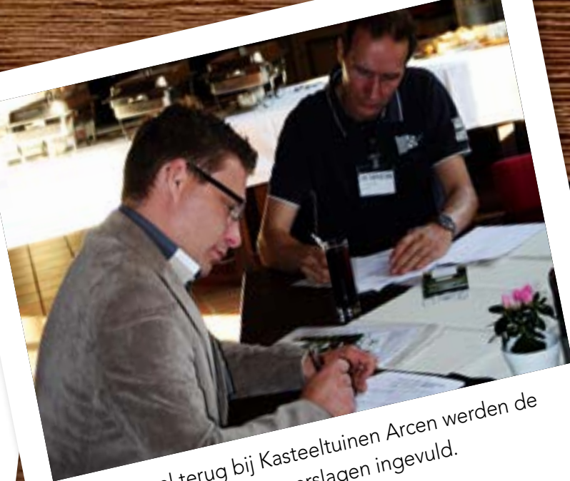
Eenmaal terug bij Kasteeltuinen Arcen werden de laatste testverslagen ingevuld.