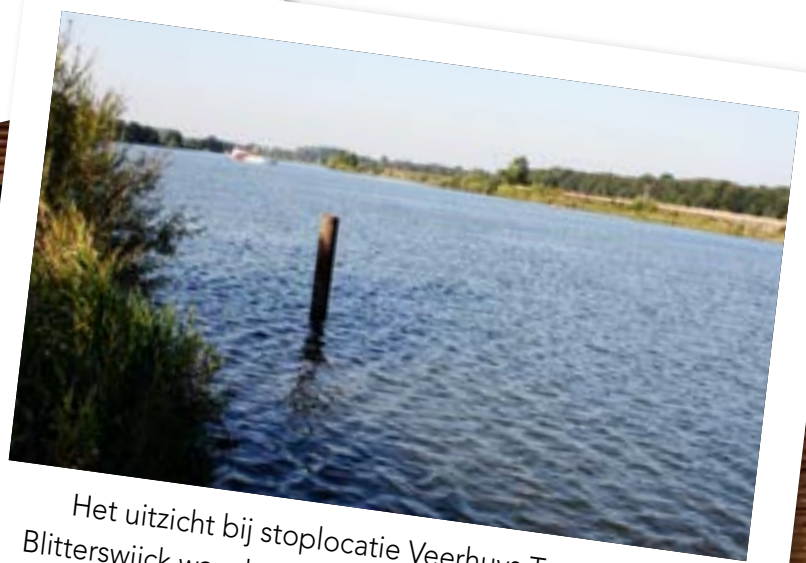
Het uitzicht bij stoplocatie Veerhuys Tante Jet in Blitterswijk was de moeite waard om even te stoppen.