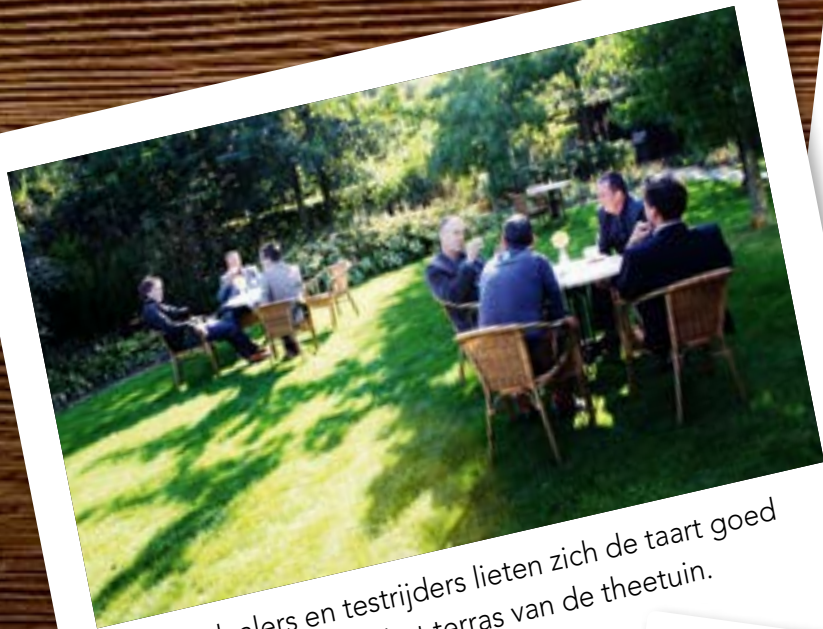
De dealers en testrijders lieten zich de taart goed smaken op het terras van de theetuin.