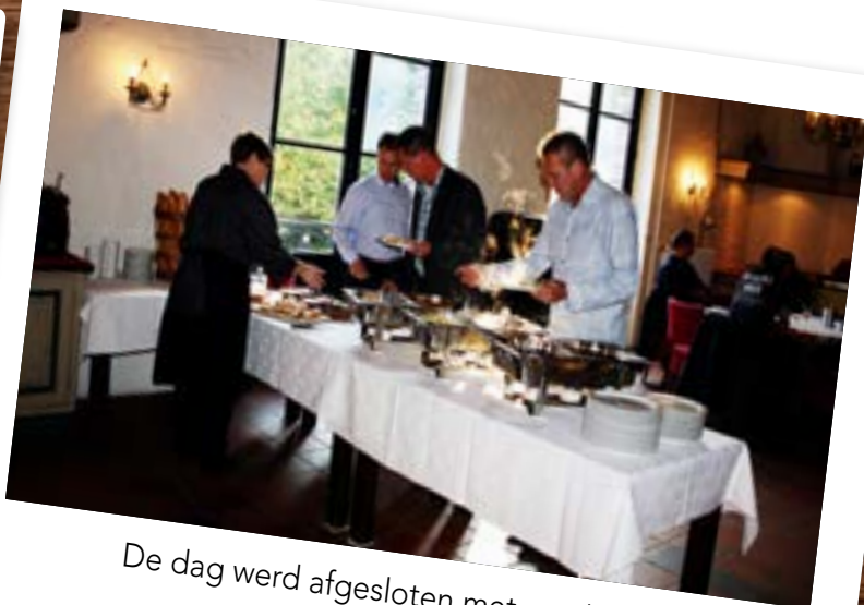
De dag werd afgesloten met een heerlijk Italiaans buffet.

Wilt u ook een keer testrijden of uw auto laten deelnemen? Neem dan contact op met Aysun Mahubessy-Saruhan 024-6421917