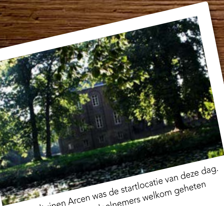
Kasteeltuinen Arcen was de startlocatie van deze dag. Hier werden alle deelnemers welkom geheten voor de lunch.