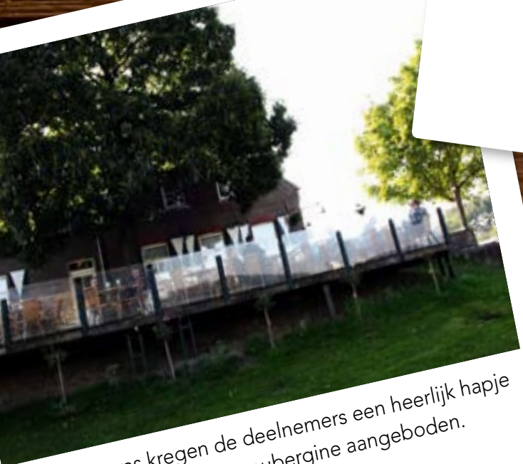
Op het terras kregen de deelnemers een heerlijk hapje van stoofvlees met aubergine aangeboden.