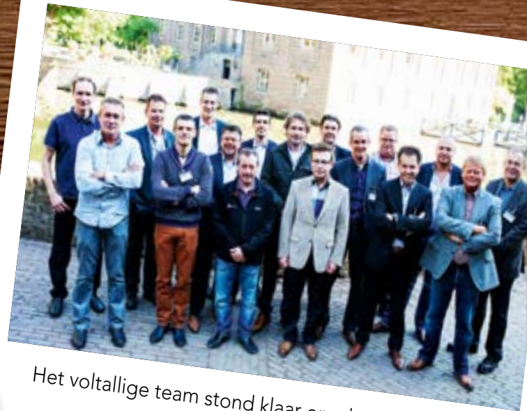
Het voltallige team stond klaar om de testauto's aan een kritische rit te onderwerpen.