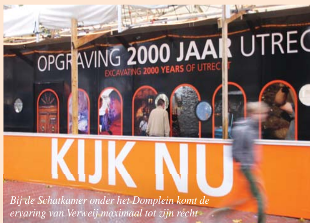
Bij de Schatkamer onder het Domplein komt de ervaring van Verweij maximaal tot zijn recht.

Techniek in gebouwen wordt steeds belangrijker. Niet alleen bij nieuwbouw, ook als het gaat om renovatie en verduurzaming. Daarom zit Roel van Stokkum van Verweij graag in een vroeg stadium als volwaardige partner om tafel met de klant. Drie voorbeelden illustreren de meerwaarde die het Nieuwegeinse installatiebedrijf in deze adviesrol realiseert.