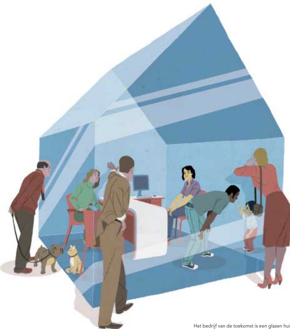
Het bedrijf van de toekomst is een glazen huis.