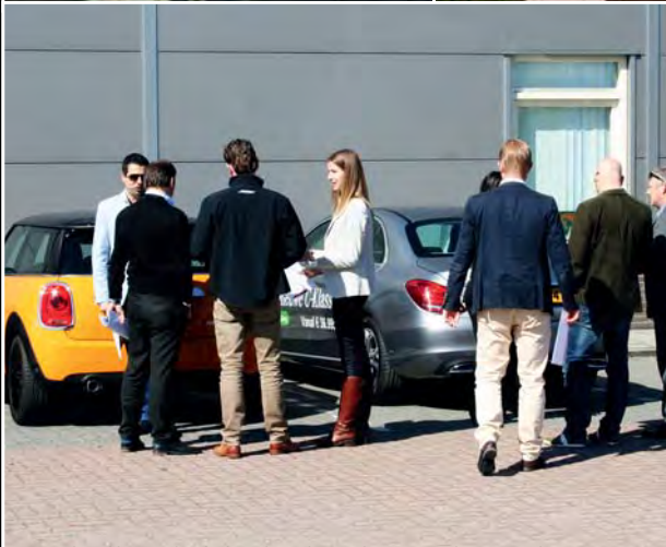
In Boekend bevond zich de volgende stoplocatie. Na het testrijden werden de prestaties van de geteste wagens uitvoerig besproken.