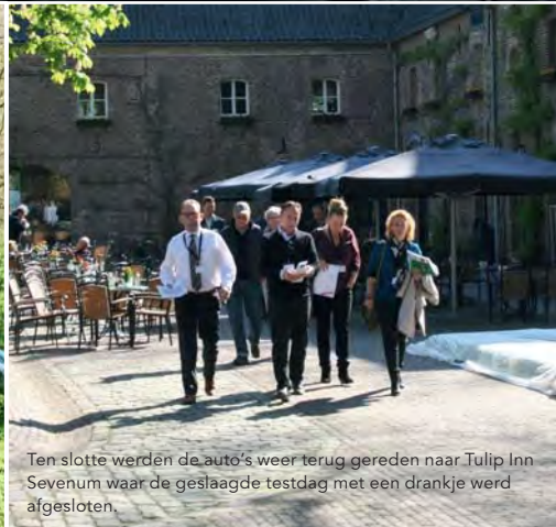
Ten slotte werden de auto's weer terug gereden naar Tulip Inn Sevenum waar de geslaagde testdag met een drankje werd afgesloten.