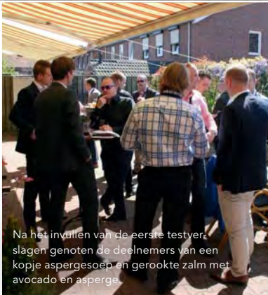
Na het invullen van de eerste testver- slagen genoten de deelnemers van een kopje aspergesoep en gerookte zalm met avocado en asperge.