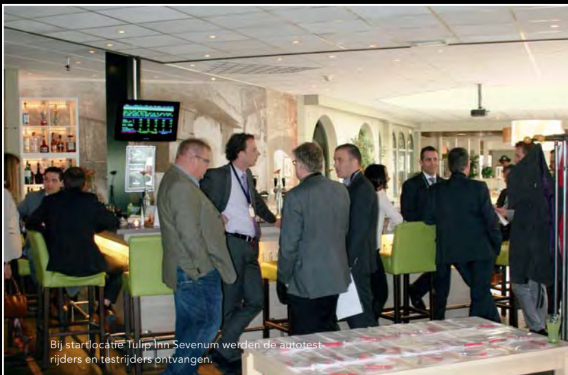
Bij startlocatie Tulip Inn Sevenum werden de autotestrijders en testrijders ontvangen.

Bekijk de video impressie van de zakentestdag op www.noordlimburgbusiness.nl !