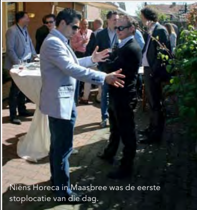
Niëns Horeca in Maasbree was de eerste stoplocatie van die dag.