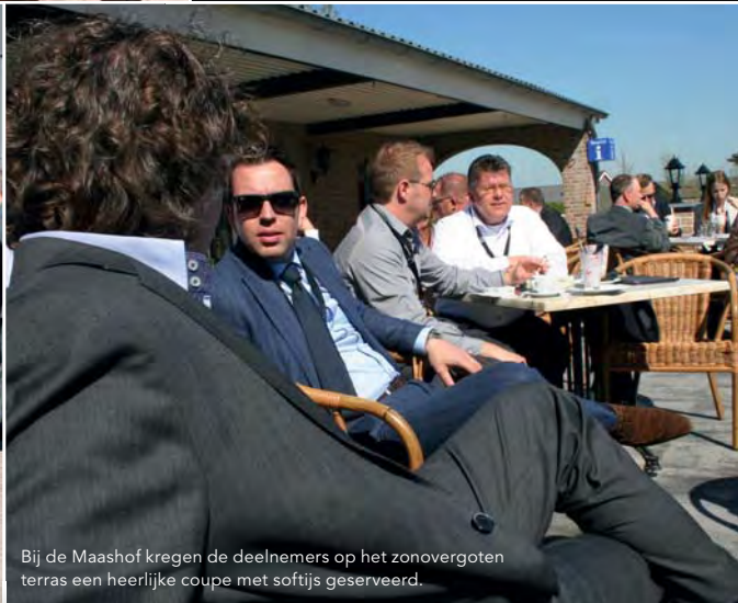
Bij de Maashof kregen de deelnemers op het zonovergoten terras een heerlijke coupe met softijs geserveerd.