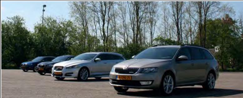
Tijdens de lunch werden de auto's op de foto gezet.