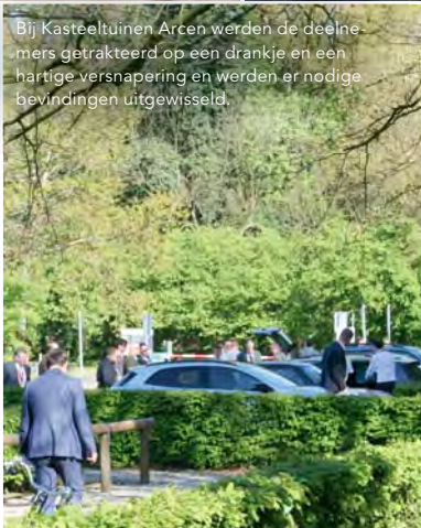
Bij Kasteeltuinen Arcen werden de deelnemers getraceerd op een drankje en een hartige versnapering en werden er nodige bevindingen uitgewisseld.