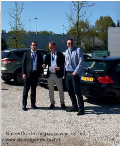
Na een korte rustpauze was het tijd voor de volgende testrij.