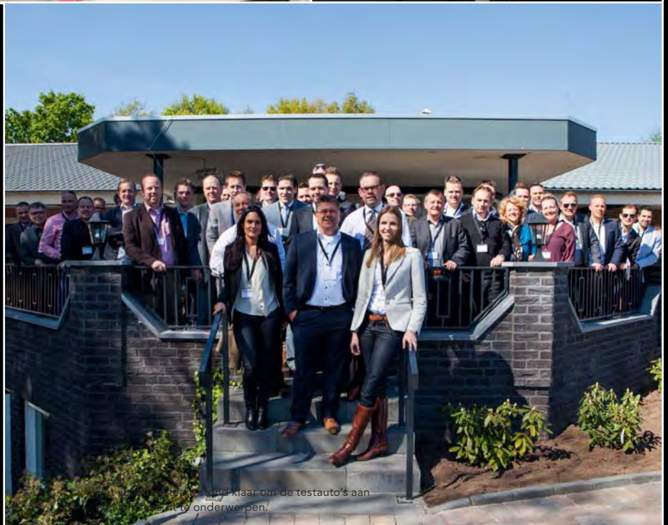
De deelnemers zijn klaar om de testauto's aan de slag te onderwerpen.