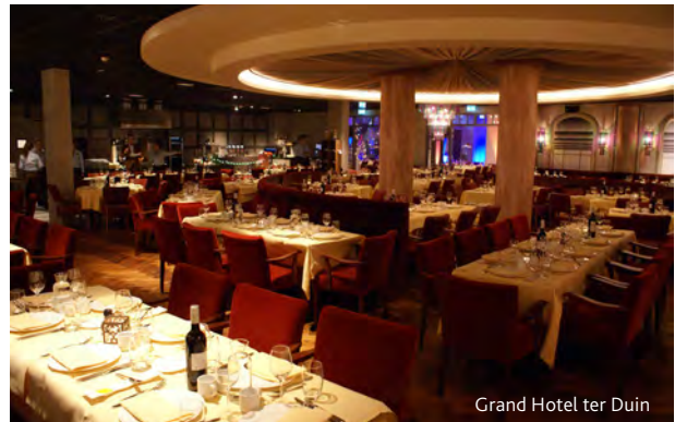
Grand Hotel ter Duin