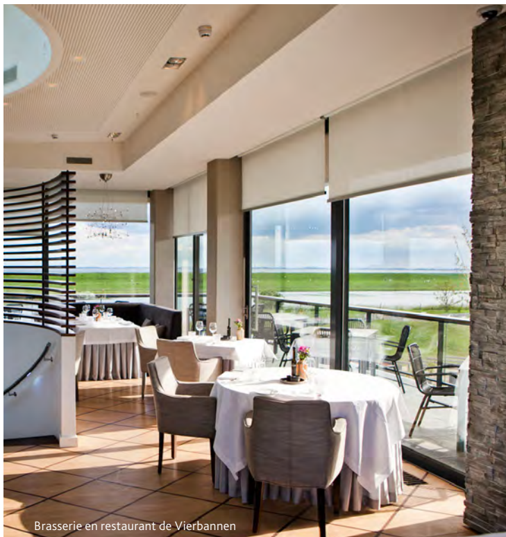
Brasserie en restaurant de Vierbannen