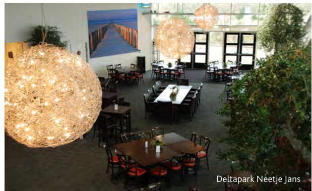
Deltapark Neeltje Jans