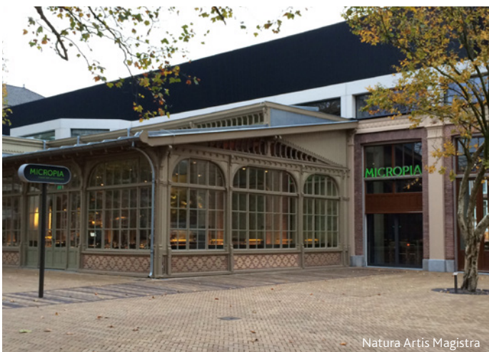
Natura Artis Magistra

Museumplein verplaatst. De nieuwe entree bestaat uit een transparant gebouw met technisch hoogstaande glasconstructies, ontworpen door Kisho Kurokawa Architect and Associates. De nieuwe toegang biedt 800 vierkante meter extra oppervlakte dat onder andere de mogelijkheden voor het organiseren van grote bijeenkomsten en ontvangsten vergroot. De vaste collectie is nog altijd te vinden op de drie in 2014 opnieuw ingerichte verdiepingen. Als eerste vallen de hypnotiserende ogen van Vincent op die muurbreed zijn afgebeeld. Tekeningen en brieven geven inzicht in de ideeën en ambities achter zijn kunstwerken. Verder is er aandacht voor belangrijke aspecten van Van Goghs kunstenaarschap zoals de mythes rondom de schilder en de impact die hij had op generaties na hem. Regelmatig wordt er een bijzonder kunstwerk tentoongesteld waarin de inspiratie en invloed van Van Gogh zichtbaar is. 'Study for a Portrait of Van Gogh VI' van Francis Bacon heeft als eerste kunstwerk deze eer.