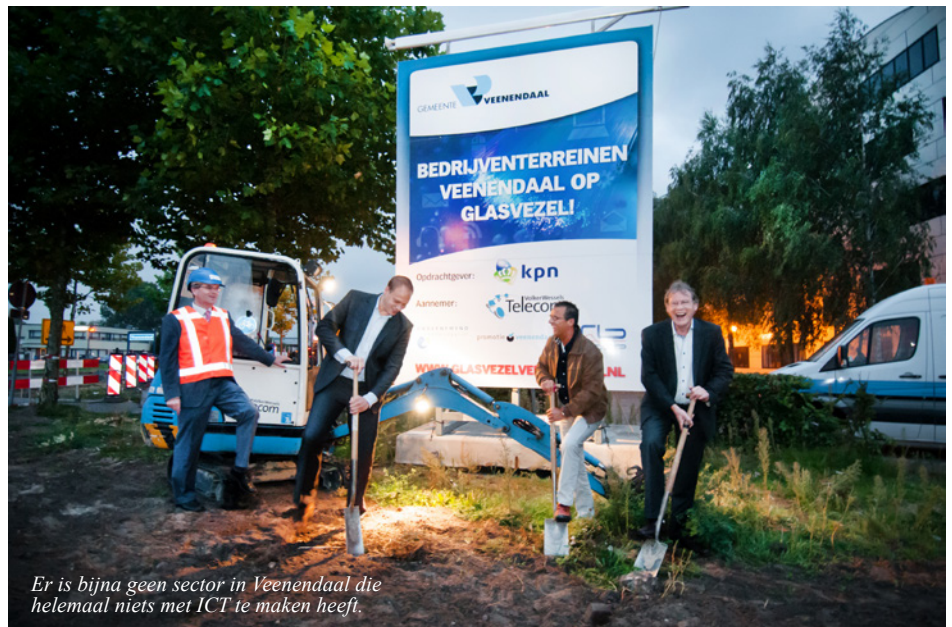
Er is bijna geen sector in Veenendaal die helemaal niets met ICT te maken heeft.

Uit gesprekken met het bedrijfsleven ontstonden vragen. Wat hebben andere sectoren hieraan? Waarom alleen ICT? Sluiten we andere sectoren niet buiten? Verloop: “Natuurlijk hebben we niet het doel om andere bedrijven buiten te sluiten, we willen hen juist versterken. Er is bijna geen sector die helemaal niets met ICT te maken heeft, waardoor iedereen hier voordeel van kan hebben.