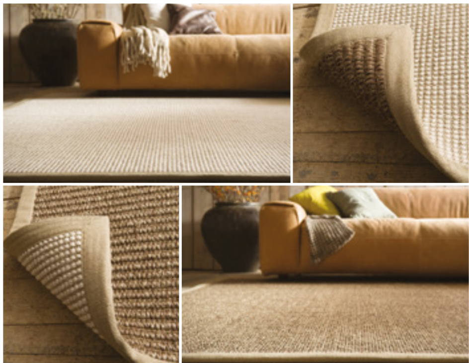
Metamorfose karpet, zowel de onderkant als bovenkant kunt u gebruiken. Verander de sfeer in uw woonkamer in een "karpetomdraai".

absorberen de deeltjes en houden deze vast om tenslotte met het stofzuigen te worden afgevoerd.