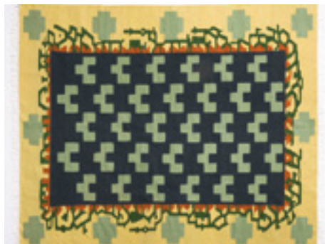
Cunera Kelims, karpetten met een eigen verhaal.

Comfort en warmte zijn over het algemeen de voordelen die worden toegeschreven aan een tapijtvloer ten opzichte van een gladde vloer. Echter; heeft u wel eens gedacht aan het mileu binnenshuis? Stof en andere zwevende deeltjes vormen een groot ongemak voor mens en dier. Met name voor allergiepatiënten of mensen die lijden aan problemen met de luchtwegen. Tapijt en karpetten