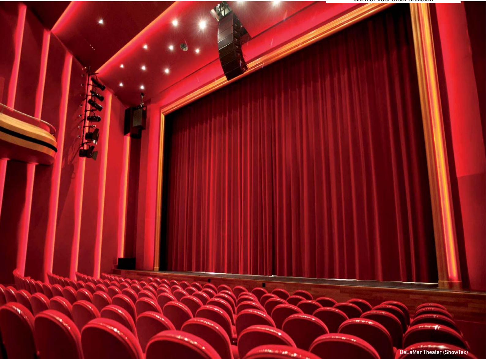
DeLaMar Theater (ShowTex)