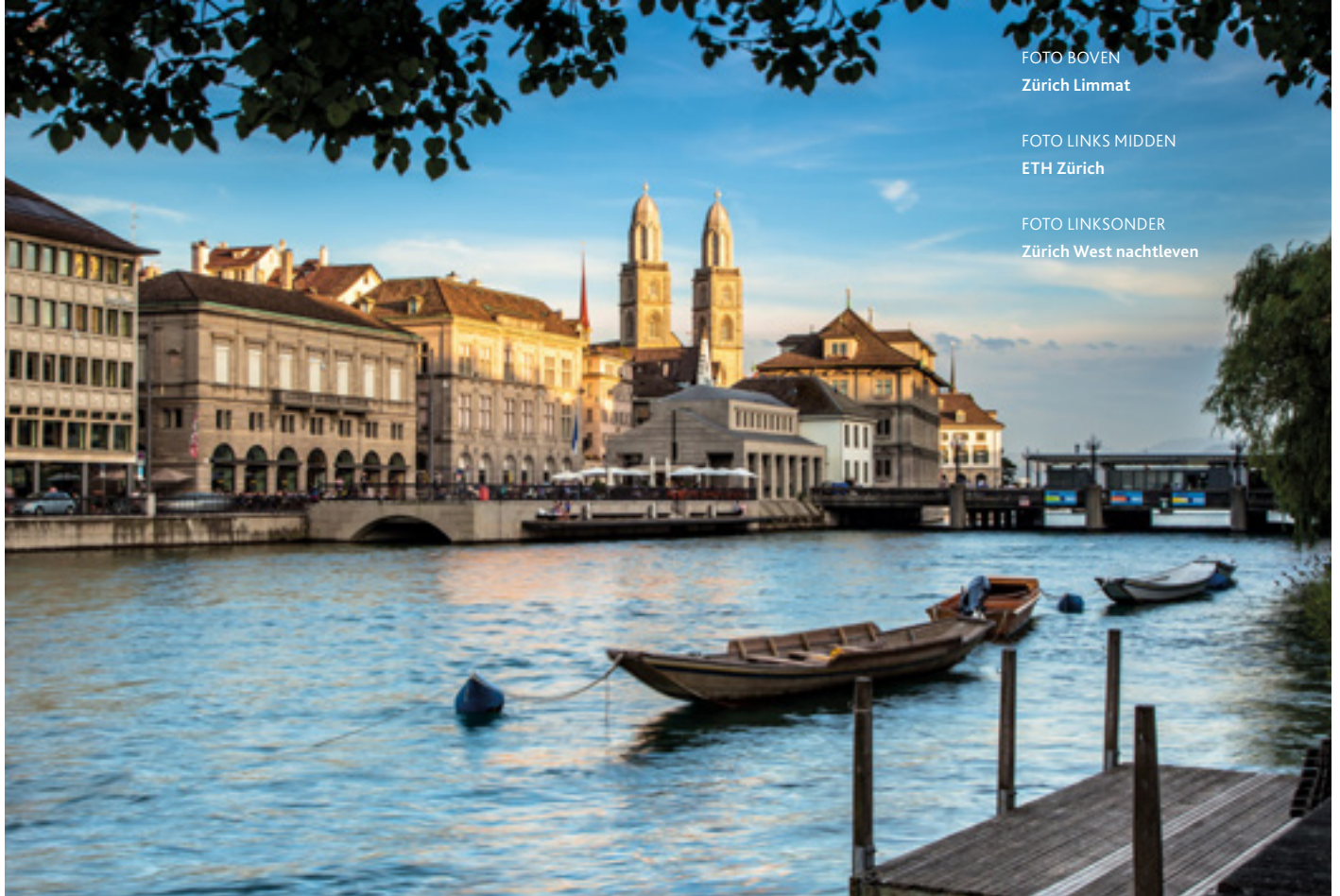
FOTO BOVEN Zürich Limmat