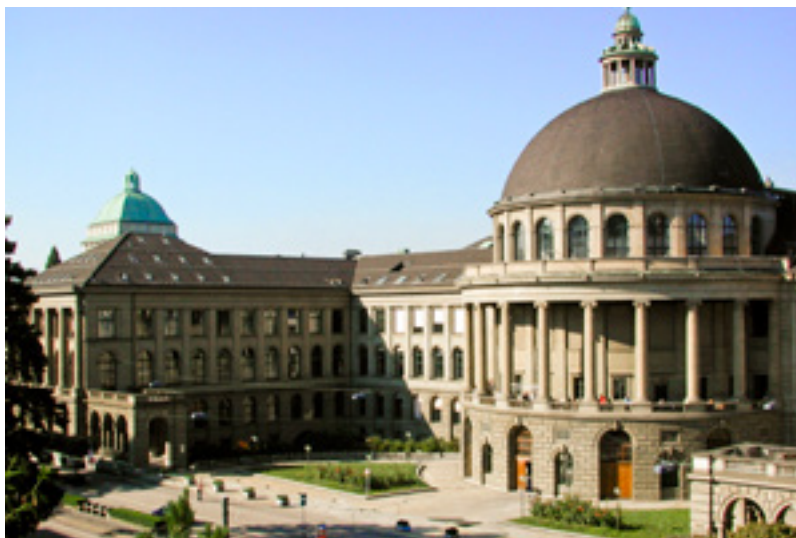
Zürich West nachtlevens