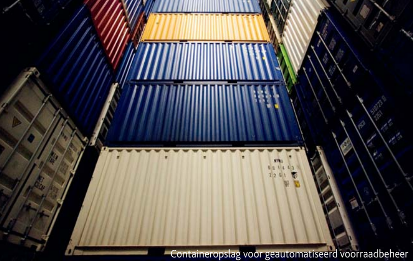
Containeropslag voor geautomatiseerd voorraadbeheer