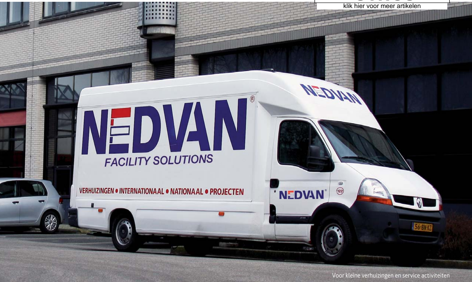
Voor kleine verhuizingen en service activiteiten