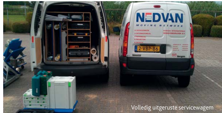
Volledig uitgeruste servicewagen

gedurende de laatste jaren tot een veel breder servicepakket gekomen: Facility Solutions. Klanten willen zo min mogelijk leveranciers. Maar die leveranciers moeten dan wel alle disciplines op het terrein van facilitaire logistiek en support services beheersen én deze door het gehele land op een efficiënte wijze kunnen aanbieden. Zo hebben wij een dienstenpakket ontwikkeld waarin het verhuizen niet meer altijd leidend is, maar een onderdeel vormt van een veel breder pakket facility solutions. Dat wil niet zeggen dat wij alles willen doen: schoonmaken, catering, beveiligen, dat zijn aparte disciplines en daar houden wij ons dus niet zelf mee bezig. Wel met het management van het verplaatsen, het beheer en het onderhoud van meubilair en deels van gebouwen. Wij hebben de producten van de divisie Facility Solutions overzichtelijk ondergebracht in een drietal sectoren: Facilitaire Logistiek, Facilitaire Services en Facilitaire Regie.”