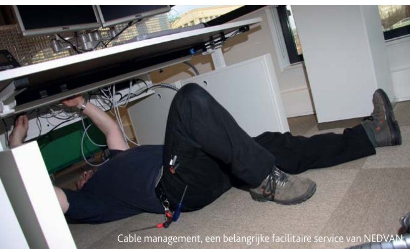
Cable management, een belangrijke facilitaire service van NEDVAN

“Wij willen onze opdrachtgevers compleet ontzorgen, bijvoorbeeld door onze activiteiten geheel in de processen van de klant te integreren, natuurlijk voor zover de klant dat wenst. Je kunt hierbij denken aan een online servicedesk of een geautomatiseerd voorraadbeheersysteem. De servicedesk houdt in dat opdrachtgevers al hun klussen binnen 1 pand of in hun gehele organisatie on line bij ons kunnen aanmelden en aangeven wanneer wij waar welke klus voor hen dienen uit te voeren. Ook bij het geautomatiseerde voorraadbeheersysteem nemen wij de opdrachtgever zijn coördinerende werkzaamheden uit handen. Zo slaan wij inventarissen niet alleen veilig op maar registreren ze naar locatie, aantal, merk, type, kleur enz. en voorzien elk object van een foto. Opdrachtgevers kunnen hun voorraad on line inzien en aangeven welke goederen ze in opslag willen laten of wanneer en waar zij ze door ons willen laten afleveren.”