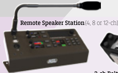
Remote Speaker Station (4, 8 or 12-ch)