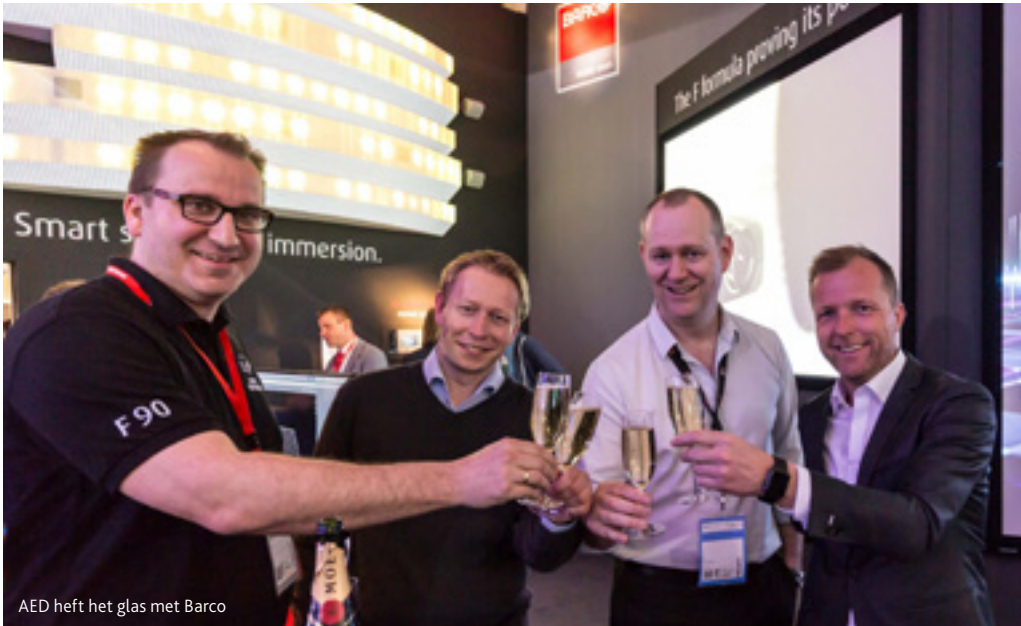
AED heft het glas met Barco

tage. Van Robert Juliat werd onder andere de ZEP Profile 660SX-300W gepresenteerd, een profielschijnwerper met een lage consumptie door de 250W LED engine. Verkrijgbaar in variabel wit, warmwit/IRC>90, neutraal daglicht wit / IRC>80 en de koelwit / IRC>90. Inclusief wireless DMX options. Ook van Robert Juliat was de Roxie 300 LED, met een ultra compacte dimensie en laag energieverbruik dé nieuwe LED volgsport. Roxie is ontwikkeld voor scholen en kleinere podia, waar hij toegepast kan worden in de smalste ruimtes. De Roxie 300 W heeft een zeer lange levensduur, instelbare openings-