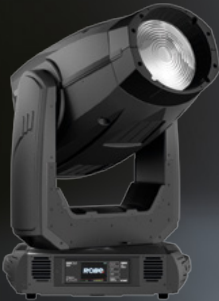
ROBE DL7F Wash™