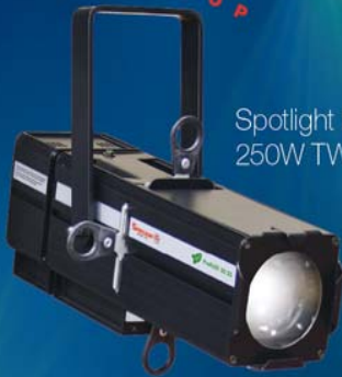
Spotlight FresneLED 250W TW DMX