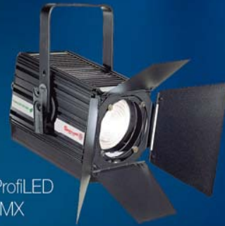
Spotlight ProfiLED ZS 50W DMX