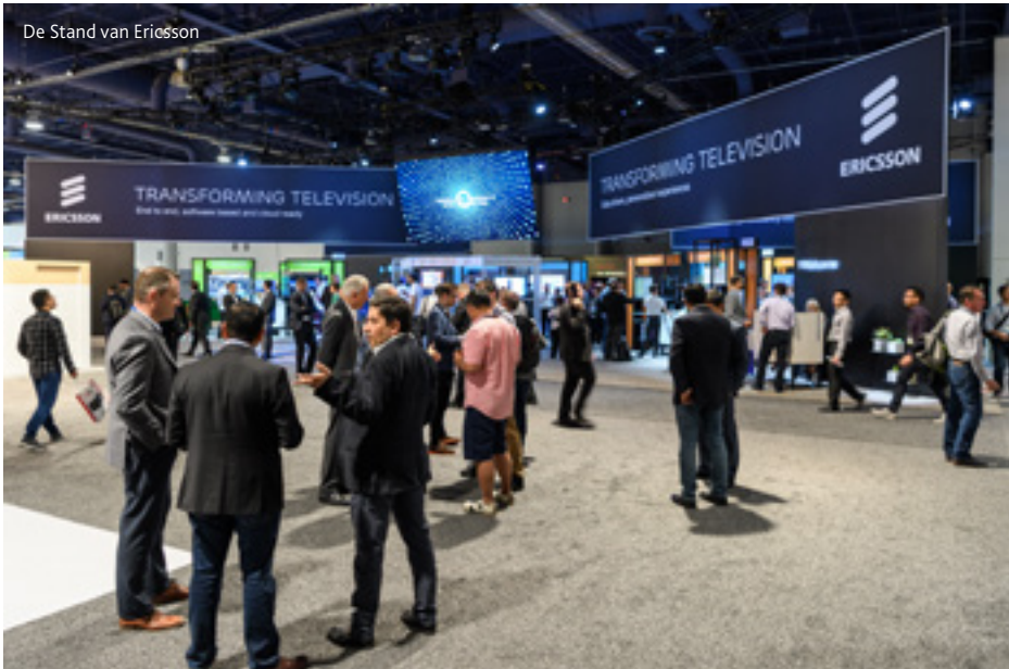
De Stand van Ericsson