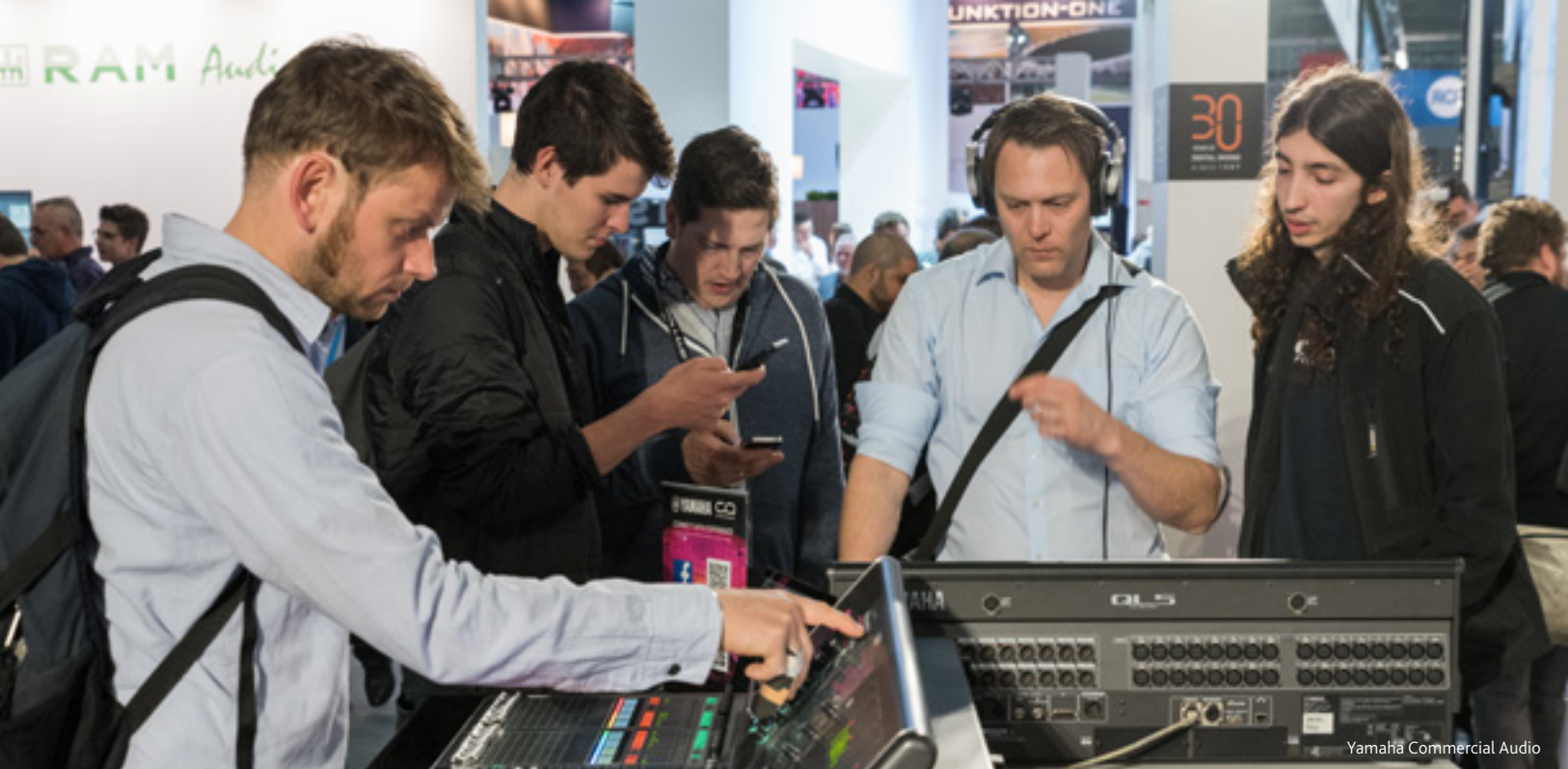
Yamaha Commercial Audio