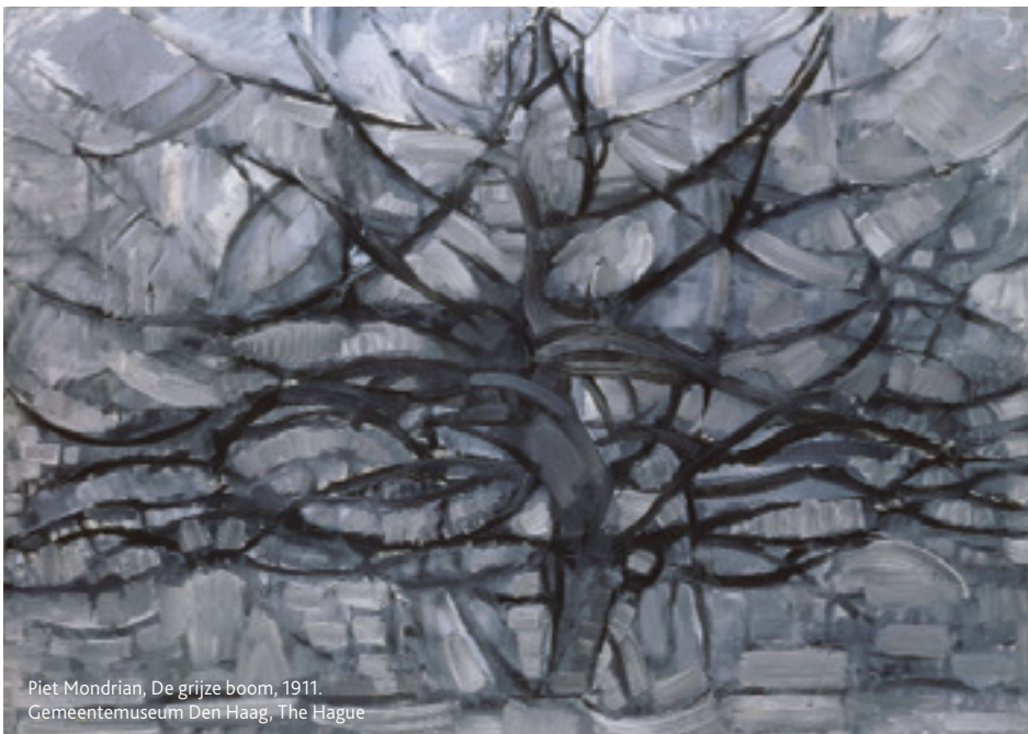
Piet Mondrian, De grijze boom, 1911. Gemeentemuseum Den Haag, The Hague

De regio Utrecht & Amersfoort wordt ook wel de broedplaats van De Stijl genoemd. Theo van Doesburg, Bart van der Leek, Gerrit Rietveld en Piet Mondriaan werden in deze regio geboren. In beide steden zijn nog veel kunstwerken en invloeden zichtbaar, en dit jaar worden met name Mondriaan en Rietveld onder de aandacht gebracht. In Amersfoort is het geboortehuis van Piet Mondriaan omgedoopt tot Mondriaanhuis. Dit museum is open voor publiek en toont