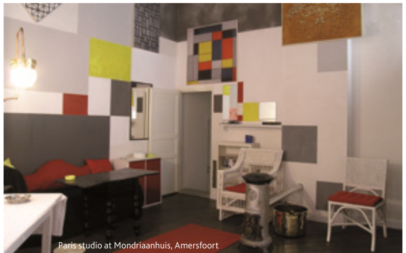
Paris studio at Mondriaanuis, Amersfoort