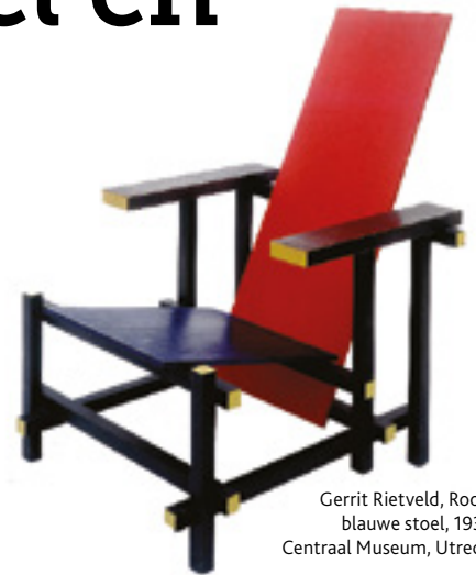
Gerrit Rietveld, Rood-blaue stoel, 1933, Centraal Museum, Utrecht

Dit jaar is het 100 jaar geleden dat er in Nederland een nieuwe kunstbeweging werd opgericht. Dit jubileum wordt gevierd met de campagne 'Mondrian to Dutch Design' van het NBTC. Heel 2017 staat in het teken van de beroemde kunstwerken en ontwerpen van De Stijl die in diverse steden in Nederland te bezichtigen zijn.