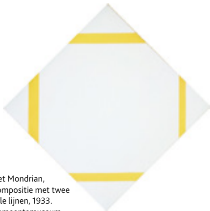
Piet Mondrian, Compositie met twee gele lijnen, 1933. Gemeentemuseum Den Haag, The Hague

bekende stoelen van Gerrit Rietveld en de schilderijen van Piet Mondriaan gekenmerkt door rechte lijnen en het gebruik van de primaire kleuren rood, geel en blauw aangevuld met zwart, wit en grijs.