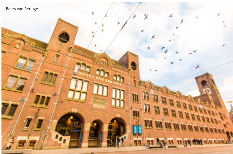
Beurs van Berlage

“De markt is sterk in beweging en de concurrentie neemt toe en zit niet stil”, legt Lindenbergh uit. “Onze overtuiging is dat de uniciteit van de aangesloten locaties meerwaarde biedt voor de (potentiële) opdrachtgever. Door samen te werken en te verbinden zal de aantrekkelijkheid van Amsterdam als bestemming voor congressen en evenementen versterken en wordt de individuele positie verstevigd.”