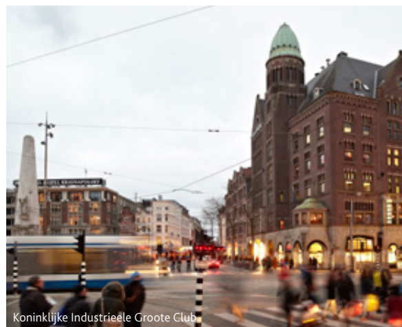
Koninklijke Industriële Groote Club

De missie van Unique Venues of Amsterdam is het bewerken van de (inter)nationale evenementen- en congresmarkt om congressen en evenementen voor de aangesloten leden en Amsterdam te werven.