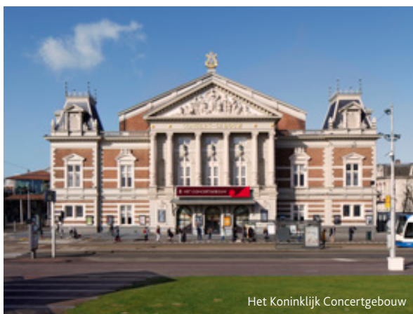
Het Koninklijk Concertgebouw

satiestructuur en is in het najaar van 2015 de eerste openbare ledenvergadering gehouden waarna de ledenwerving is gestart. In 2016 is de vereniging gelanceerd.