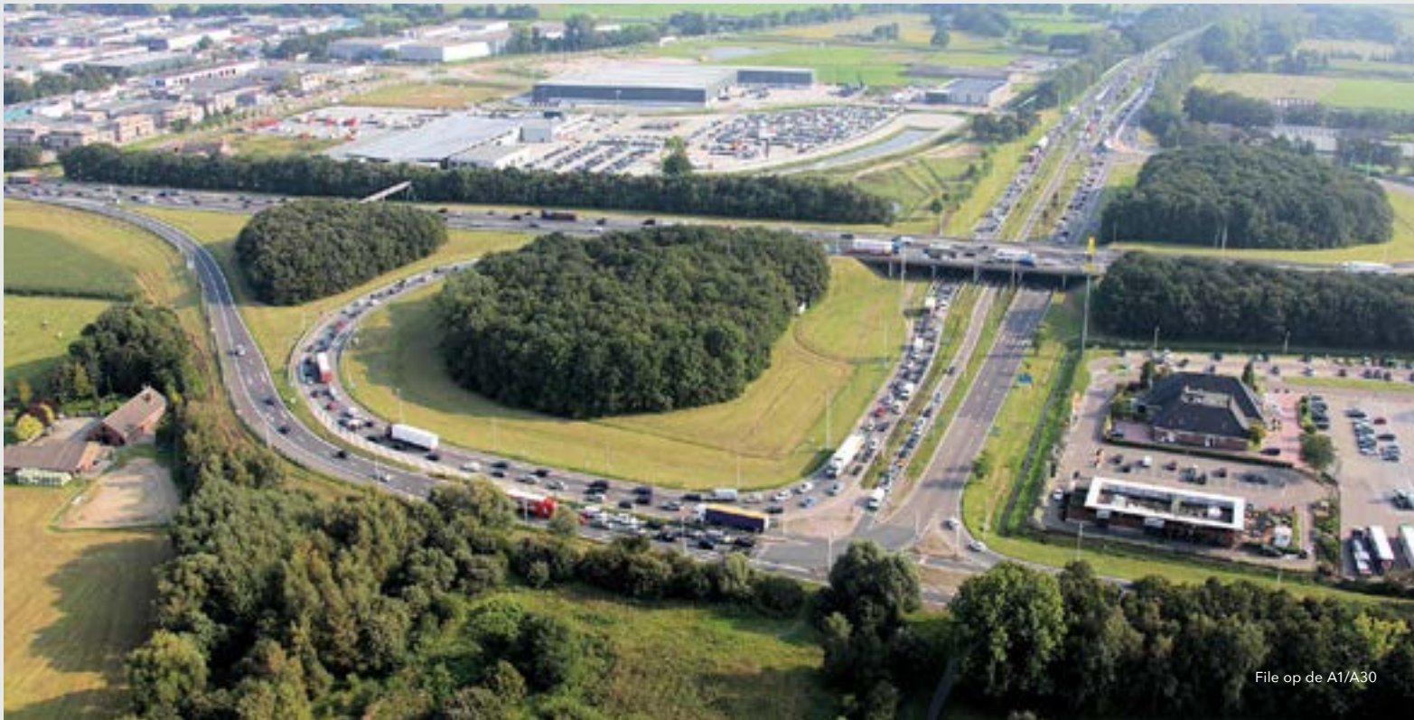
File op de A1/A30