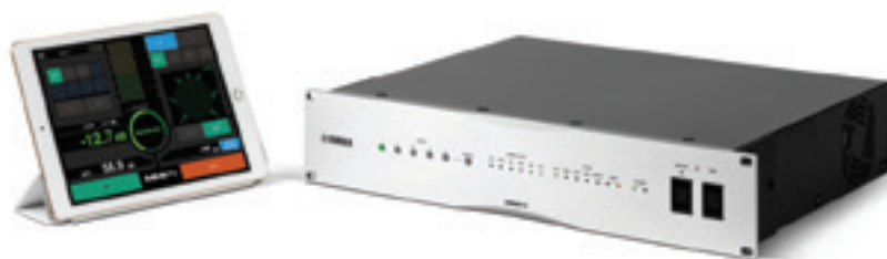
The MMP1 Studio Monitor Management System: Part of Yamaha's continuing commitment to enhancing the audio production process

Versatile, great-sounding and refreshingly affordable, the new Yamaha MMP1 brings sophisticated monitor management to DAW-based production environments. From stereo through to complex, multi-channel formats like Dolby Atmos, MMP1 delivers flexible routing of all essential audio throughout the studio, along with the powerful bass management control, time alignment delays and six-band room EQ necessary to optimise your monitoring for your production space. MMP1 is easy to configure and operate via Mac/Windows Apps, and there's also an iPad App for convenient control of all essential parameters.